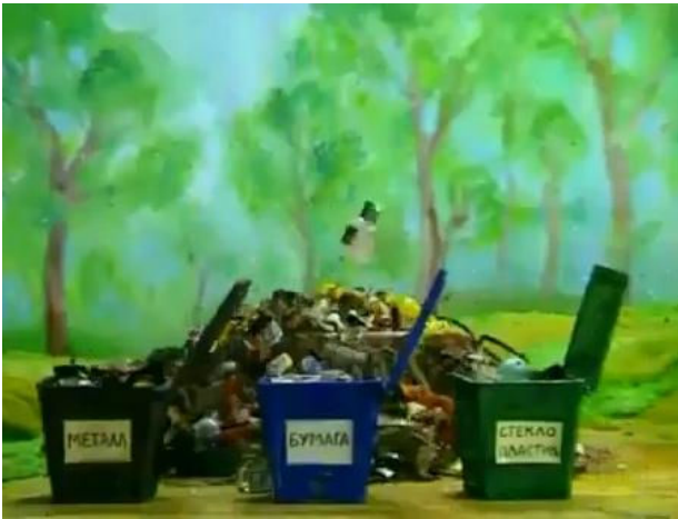
Рис. 10. «Ще один спосіб допомогти природі» Техніка: stop motion-анімація

«Дім» — запущена ціла серія телевізійних рекламних роликів «GreenPeace». Екологічне мистецтво — це найдоступніший і найрозуміліший спосіб достукатися до кожного, тому що воно різноманітне за формами, щиро, наочно, образно і торкається найглибших струн — моральних.