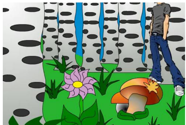
Рис. 6. Анімаційний ролик «Дім» flash-анімація