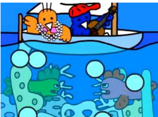
Рис. 7. Анімаційний ролик «Екологія»: покадрова класична анімація