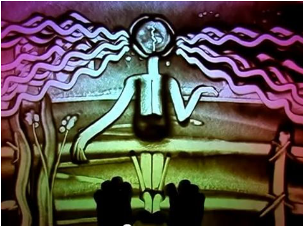
Рис. 1. Анімаційний музичний ролик «Бережи» пісочна анімація