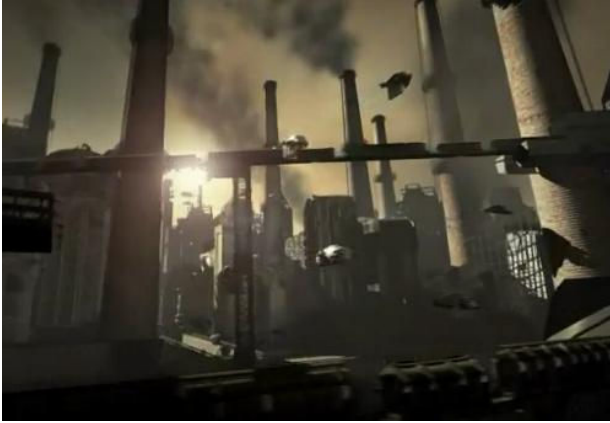
Рис. 9. Музичний ролик «Природа та цивілізація» 3D технологія