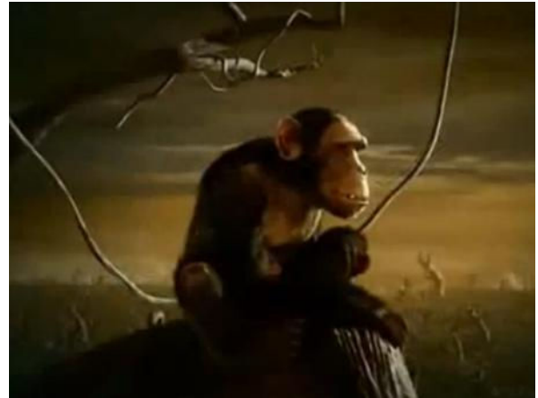
Рис. 2 Анімаційний музичний ролик «Глобальне потеплення» (3D анімація, анімація персонажу)