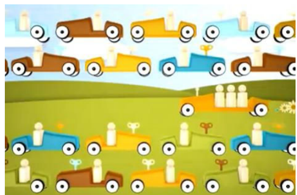
Рис. 8. Екологічний анімаційний ролик «Позитивна планета» 3D і 2D — змішана техніка