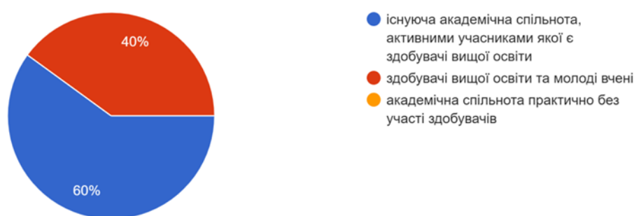
Рис. 4 – Кількість варіантів відповідей на питання: «Хто, з Вашої точки зору, забезпечує динаміку розвитку освітнього середовища, визначає його сучасний стан та формує перспективи його подальшого генезису?»

Студенти третього курсу, надаючи відповідь на питання: «Хто, з Вашої точки зору, забезпечує динаміку розвитку освітнього середовища, визначає його сучасний стан та формує перспективи його подальшого генезису?» переважною кількістю голосів (60% від загальної кількості осіб, які брали участь у опитуванні) обрали відповідь: «Існуюча академічна спільнота, активними учасниками якої є здобувачі вищої освіти». Рештка групи (40% опитуваних) вважає, що динаміку розвитку освітнього середовища визначають здобувачі вищої освіти та молоді вчені.