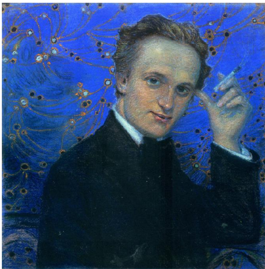
Іл. 2. Л. Тракал. Портрет Л. Л. Тракала з сигарою. Поч. 1910-х. Карт., наст. 0,3 × 50,1