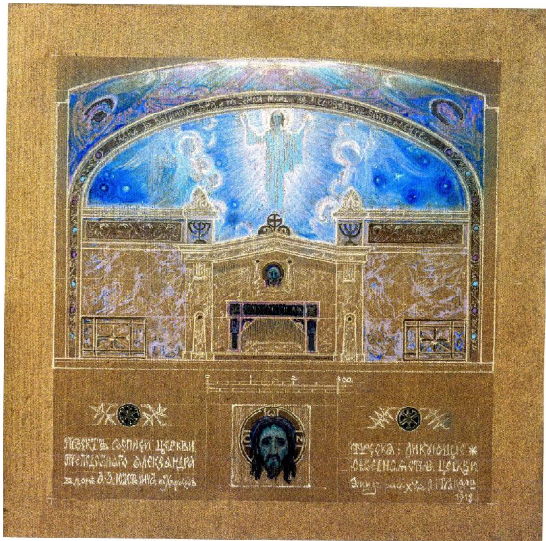
Іл. 4. Л. Тракал. Радіють. Північна стіна домової церкви друкарні О. Юзефовича. Ескіз фрески. 1918. Карт., наст. 52,8 × 52,3