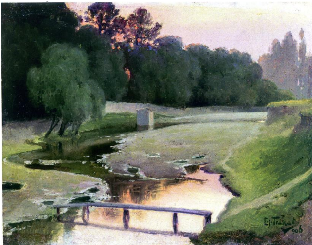
Іл. 1. Л. Тракал. Озеро. Етюд. 1906. Карт., о. 19,4 × 25,4. ХХМ