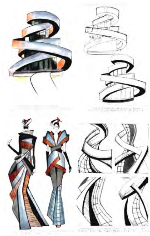
Рис. 1. Ескізна розробка костюму за джерелом творчості сучасної архітектурної будівлі. Виконала ст. 2к., ДО(в), ХДАДМ Овсяннікова К. Викладач Васильєва М.І.