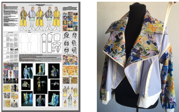
Рис. 4. Дипломний проєкт студентки магістратури і фрагмент реалізації в матеріалі принтованого верхнього одягу. Сублімаційний друк на кольоровій тканині. Вик. студ. К. Лавріненко, керів. О. Лагода, конс. Т. Малік. 2020 р.

символізації зображень, матеріали і технології), роль принтів в етнічних, національних культурах, розвиток і актуалізація в моді різних історичних періодів;