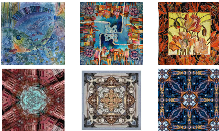
Рис. 1. Роботи студентів кафедри дизайну тканин і одягу ХДАДМ. Хустки виготовлено в техніці холодного батику та за технологією цифрового друку. Вкл. Т. Малік. 2019 – 2021 рр.

Однією з найголовніших переваг хустки є її універсальність, оскільки її можуть носити і чоловіки, і жінки незалежно від віку. Варіантів застосування аксесуара сьогодні існує безліч. Розмір хустки, зазвичай, обумовлено її функцією (призначенням), тому їх умовно поділяють на три категорії: головні (від 70 до 120 см); шийні (від 40 до 70 см); носові хустинки