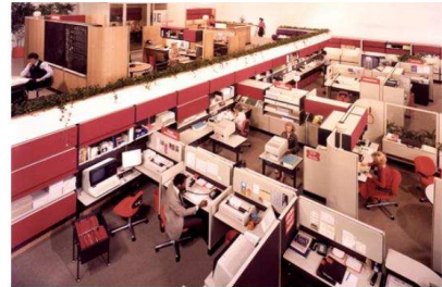
Рис. 3. Action Office" - кубікл