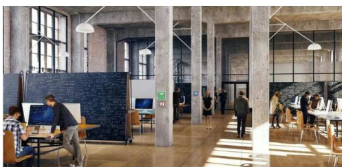
Рис. 4. Коуворкінг офіс