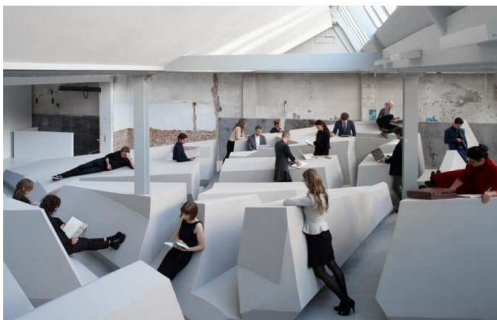
Рис. 5. Офіс "Кінець сидінню"