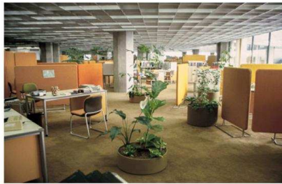
Рис. 2. Офіс "Бюроландшафт"