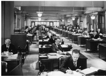
Рис. 1. "Фабричний формат" офісу

Однак активне зростання оброблюваної офісними працівниками інформації, а головне її різноманітність вимагали відходу від "фабричного формату" офісів. Потрібно було створити кожному клерку спеціалізоване робоче місце, з певним відсотком кастомізації (індивідуальної адаптації та налаштування), а значить і приватності. Одночасно було потрібно посилити інтеграцію та полегшити спілкування між співробітниками. Тобто працівники мають отримати унікальне робоче місце, залишаючись при цьому згуртованою командою.