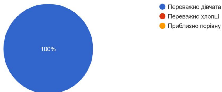
Рис. 2 – Кількість варіантів відповідей на питання: «На Вашій спеціалізації навчаються переважно дівчата чи хлопці?»