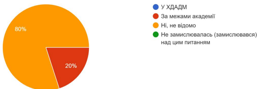
Рис. 3 – Кількість варіантів відповідей на питання: «Чи відомо Вам про факти сексуальних домагань?»

3. Чи відомо Вам про факти сексуальних домагань? 10 ответов