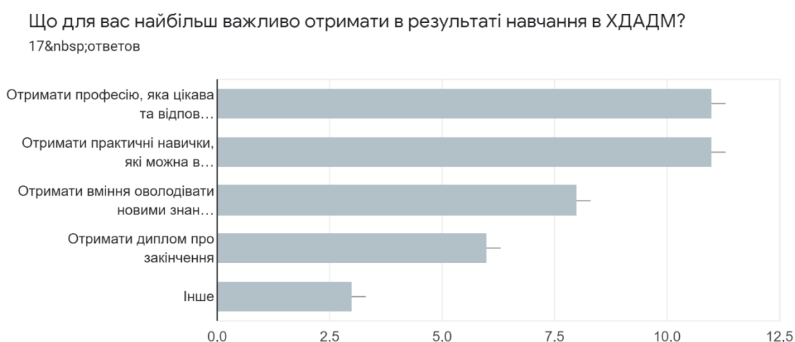
Рис.1 – Кількість варіантів відповідей на питання «Що для вас більше важливо отримати в результаті навчання в ХДАДМ?»

Третє за вибором пріоритету для 35,29% опитуваних – отримати вміння оволодівати новими знаннями, які допоможуть швидко адаптуватися на арт-ринку і в житті. На жаль, 5,8% студентів не вказали, що мають на увазі, чому на другому місці для них «інше» і чому «інше» на третьому місці вибору для 5,8% респондентів (рис.1).