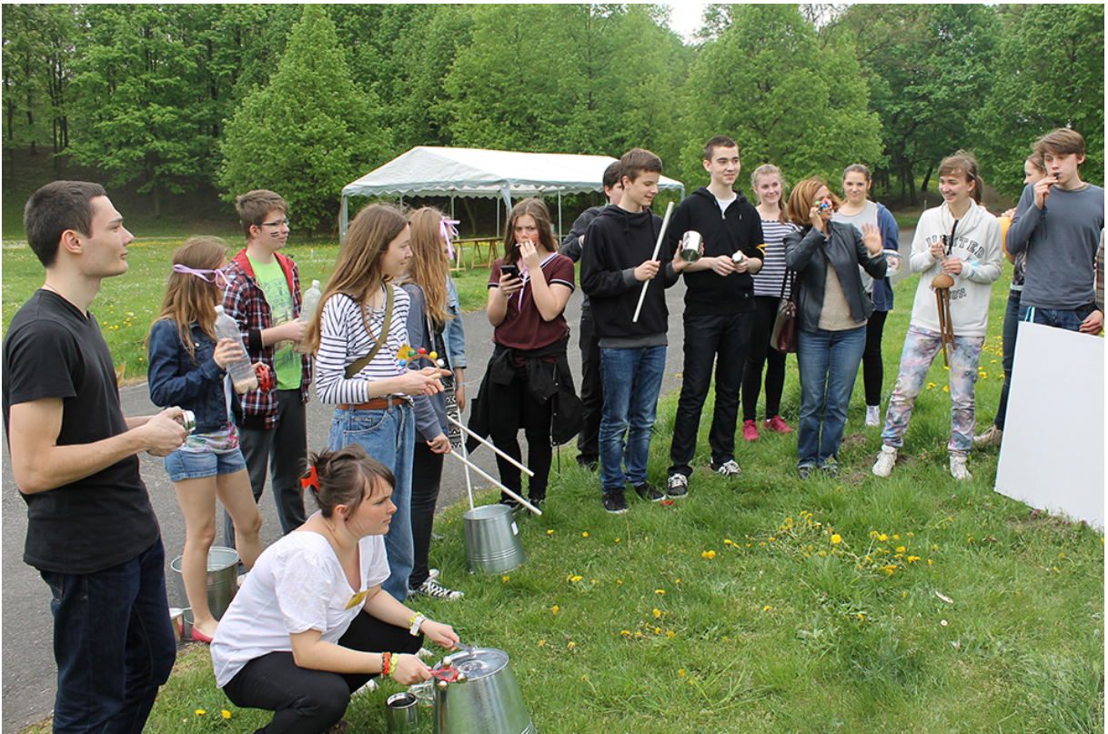
Фото 46. Проект «Безладна суміш звуків», 2015 р.