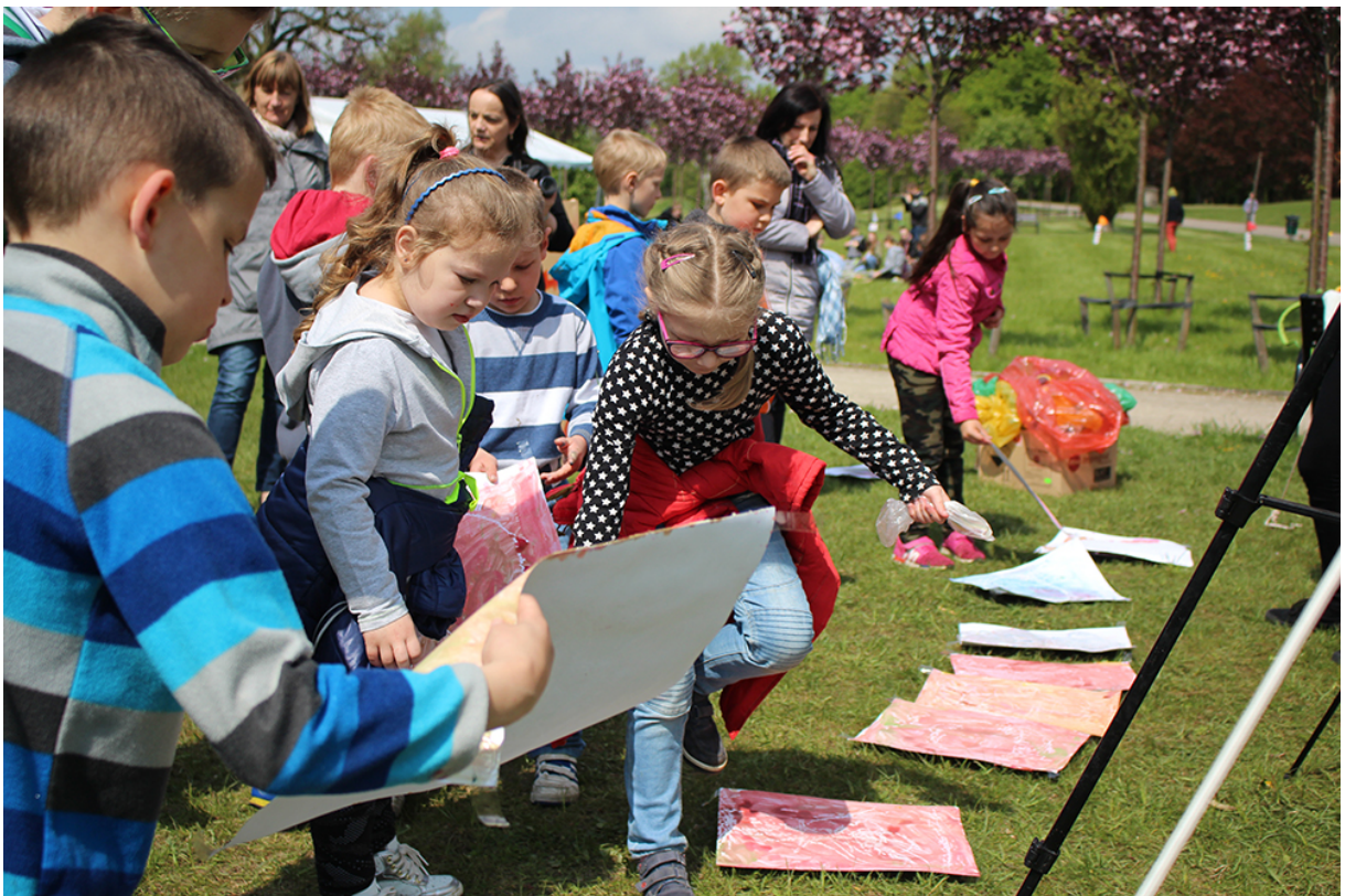
Фото 66. Проект «Невидимый портрет», 2017 р.