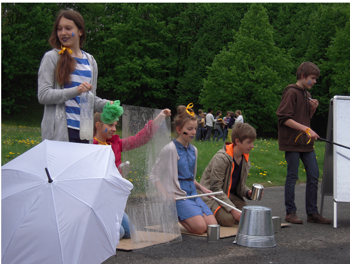
Фото 48. Проект «Безладна суміш звуків», 2015 р.