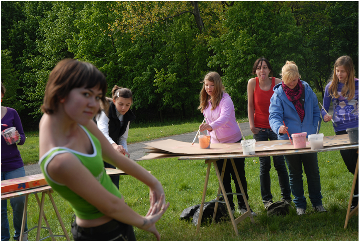
Фото 9. Проект «Малювання танцю», 2009 р.