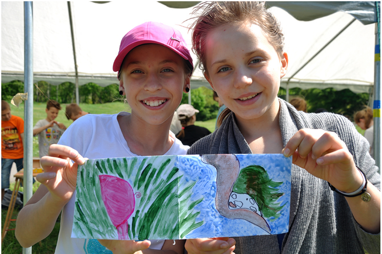
Фото 55. Проект «Мікрокосмос», 2016 р.