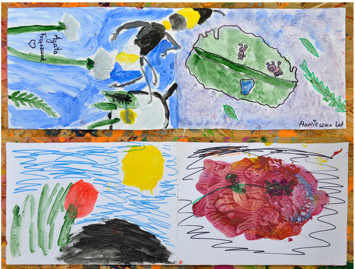
Фото 56. Проект «Мікрокосмос», 2016 р.