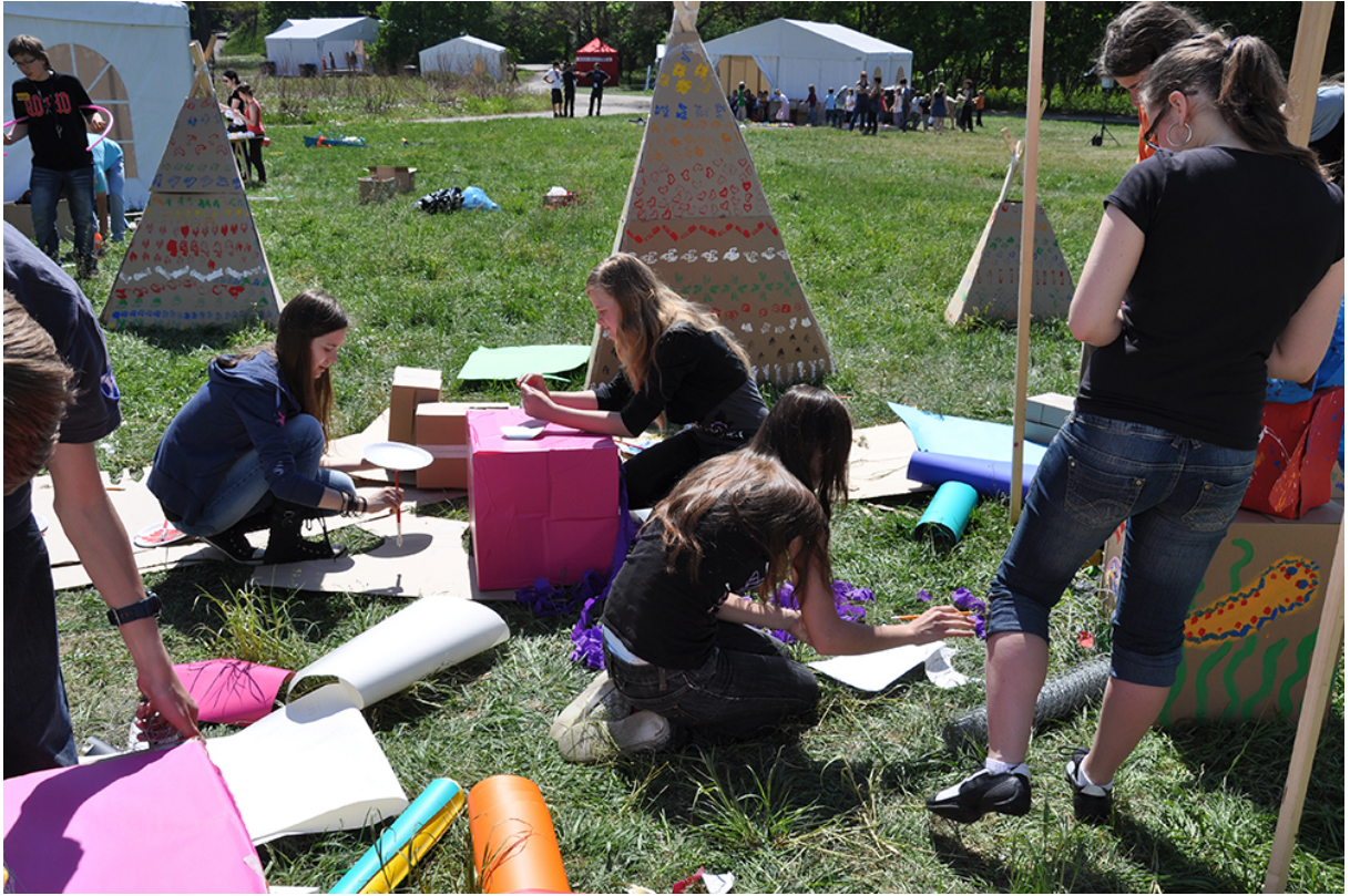
Фото 25. Проект «Сучасне індіанське селище», 2011 р.