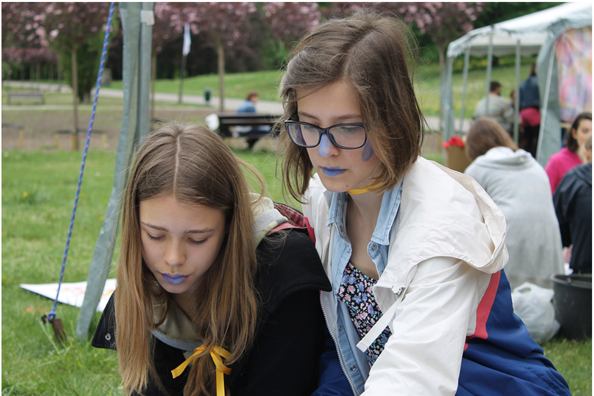
Фото 51. Проект «Безладна суміш звуків», 2015 р.