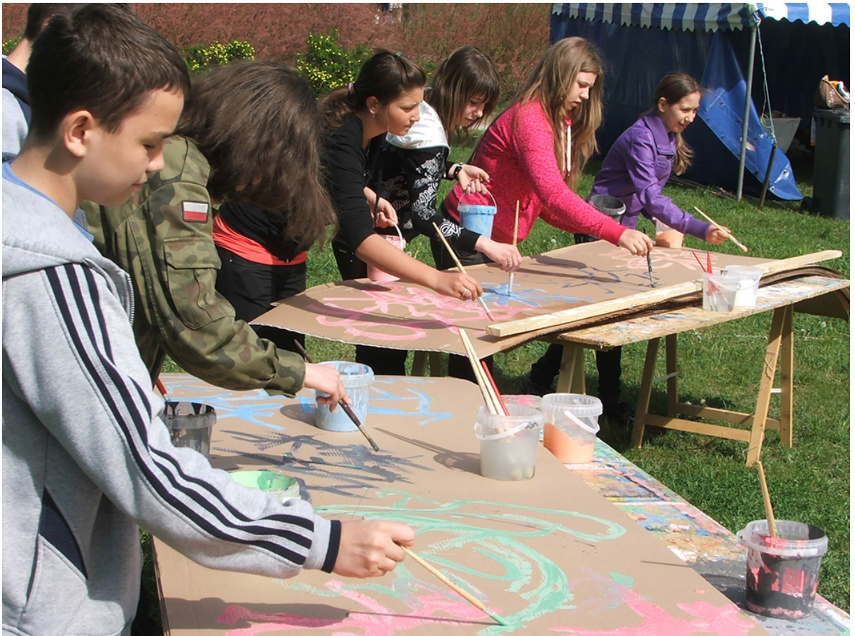
Фото 11. Проект «Малювання танцю», 2009 р.