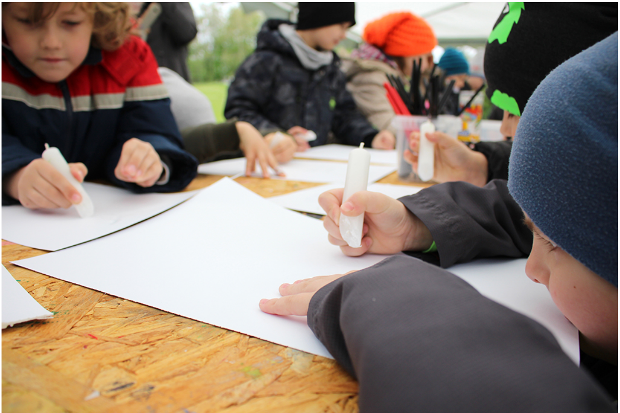
Фото 61. Проект «Невидимый портрет», 2017 р.