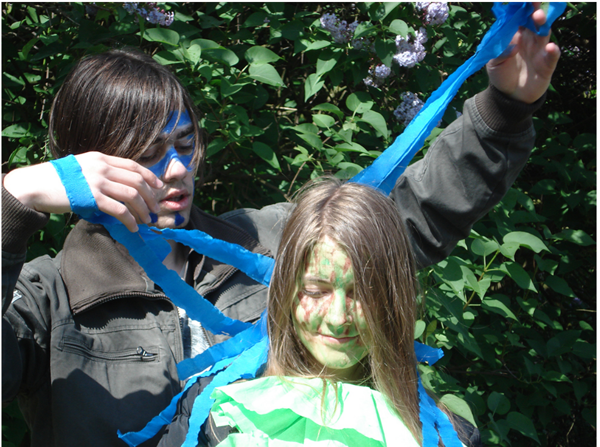
Фото 3. Проект «Фото-історія», 2007 р.