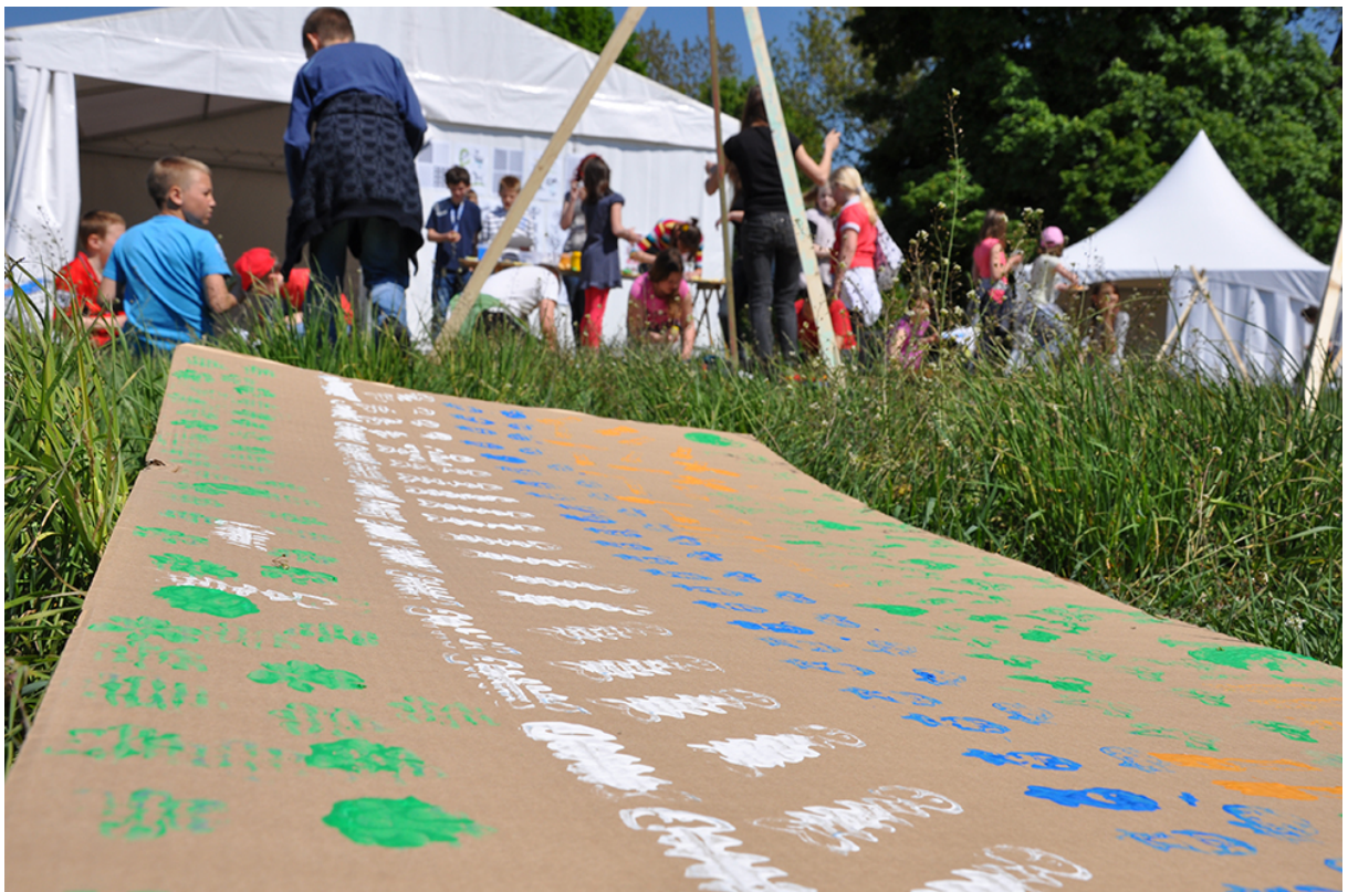
Фото 24. Проект «Сучасне індіанське селище», 2011 р.