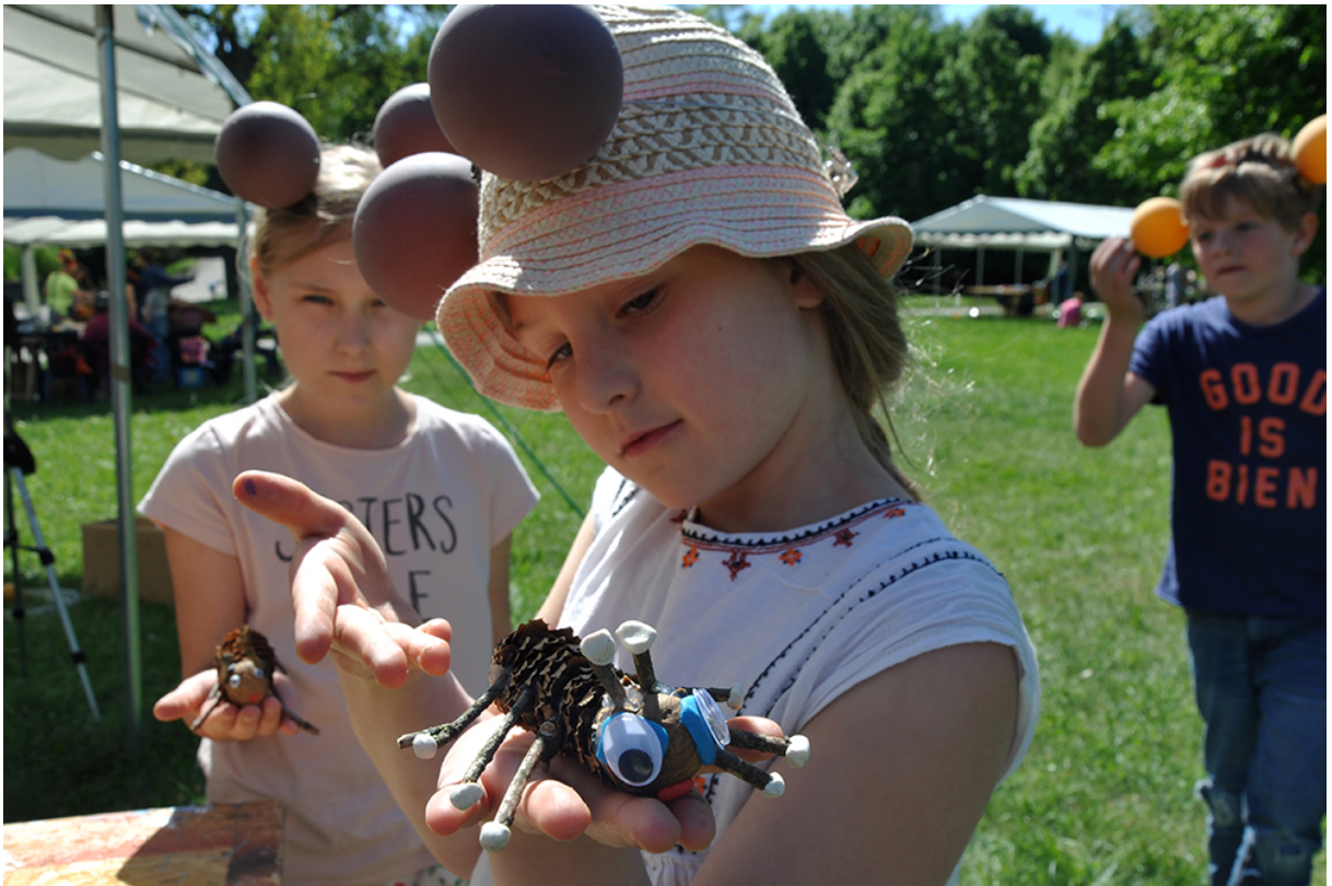
Фото 69. Проект «Стоп-моушн комах», 2018 р.