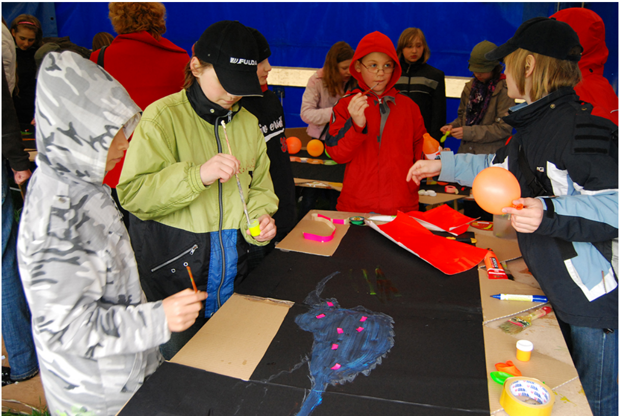
Фото 15. Проект «Свій світ», 2010 р.