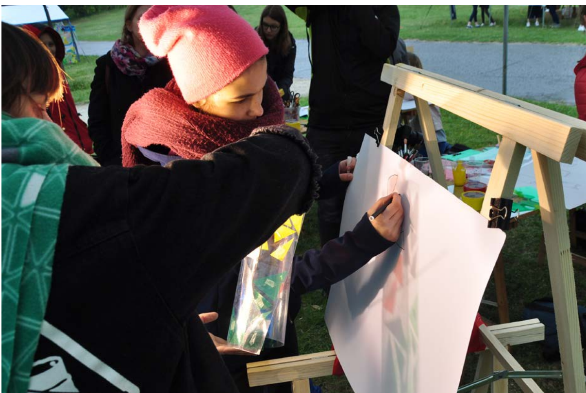
Фото 72. Проект «Від мистецтва до мистецтва», 2019 р.