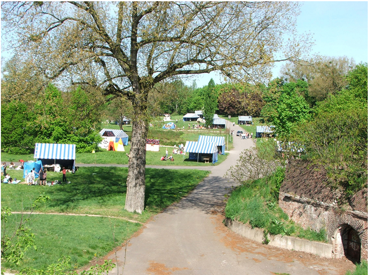
Фото 1. Місце проведення Міжнародних майстер-класів творчого неспокою «Кишенька Вінсента», Познань, парк Цитадела, 2008 р.