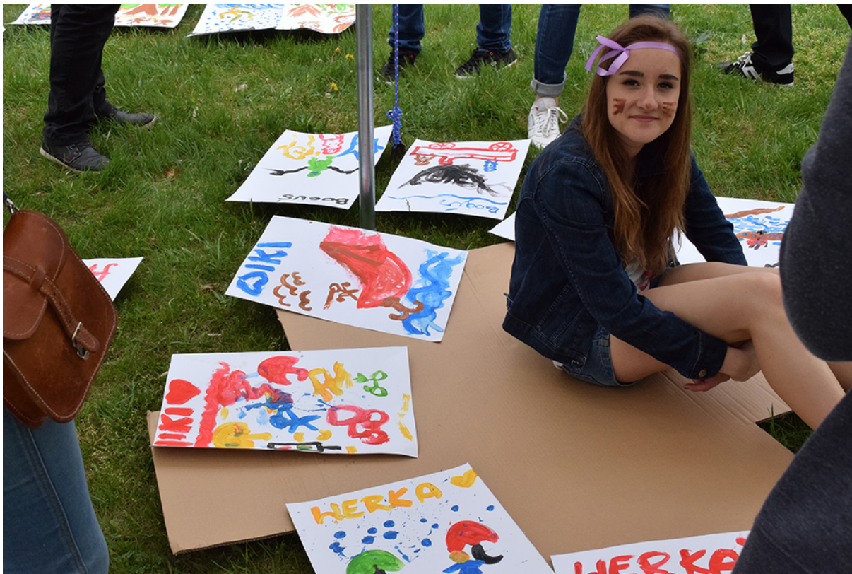
Фото 47. Проект «Безладна суміш звуків», 2015 р.