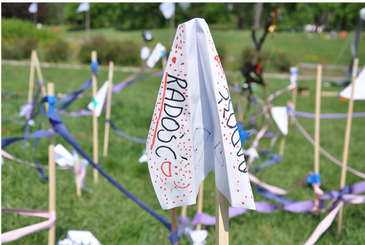
Фото 36. Проект «Форма слова», 2013 г.