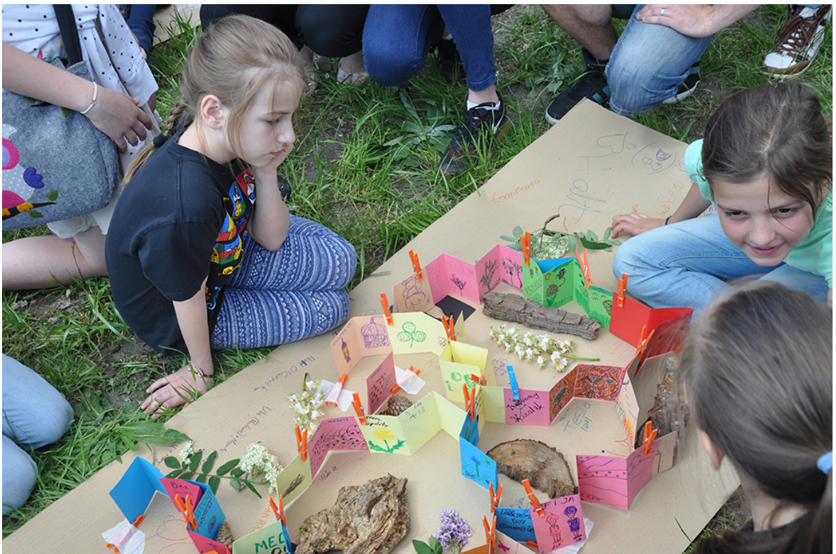
Фото 58. Проект «Мікрокосмос», 2016 р.