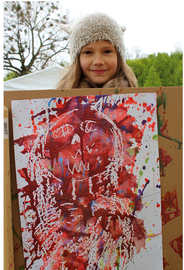
Фото 64. Проект «Невидимый портрет», 2017 р.