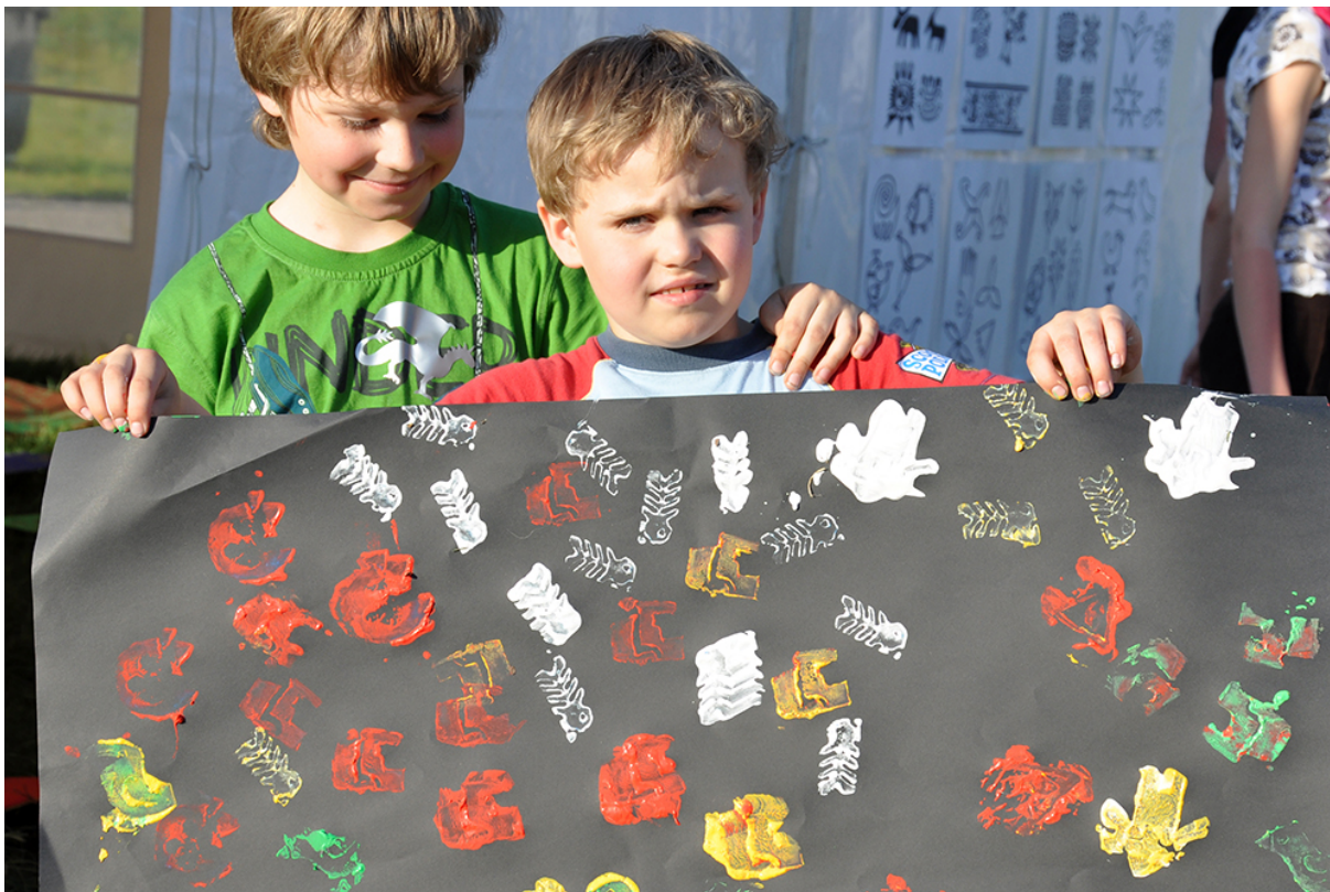
Фото 31. Проект «Сучасне індіанське селище», 2011 р.