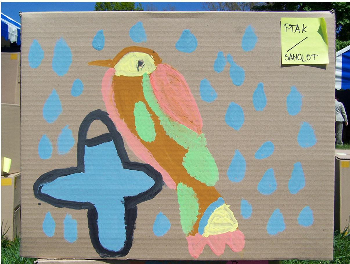
Фото 6. Проект «Сторони прогресу», 2008 р.