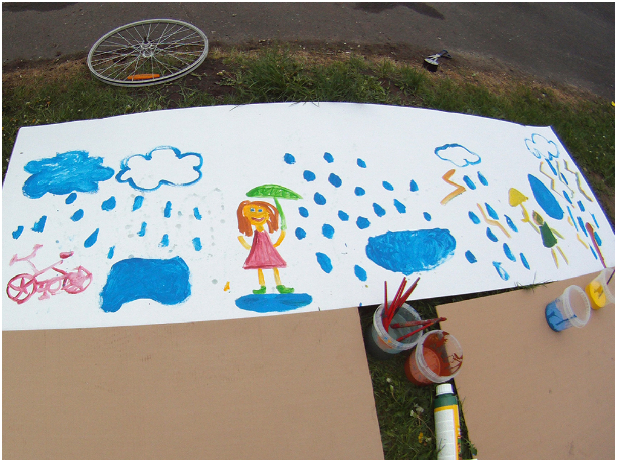
Фото 49. Проект «Безладна суміш звуків», 2015 р.