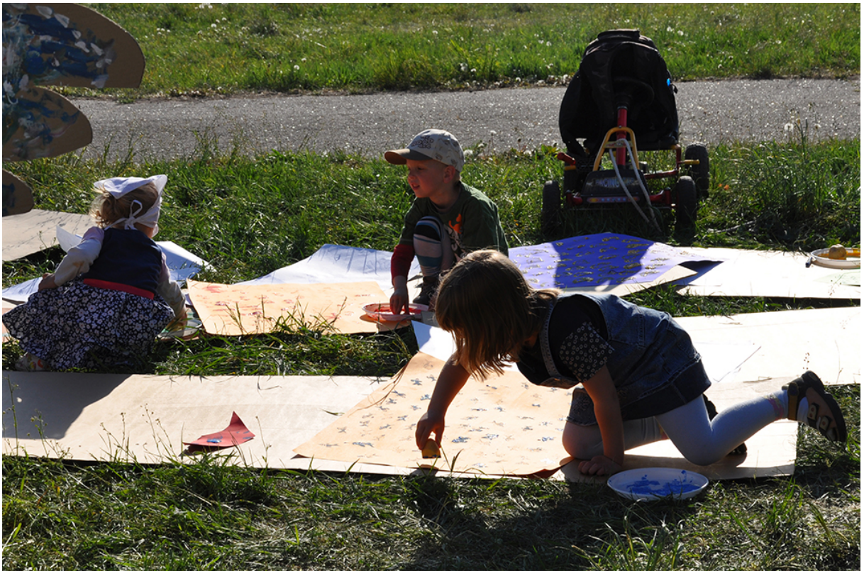
Фото 30. Проект «Сучасне індіанське селище», 2011 р.