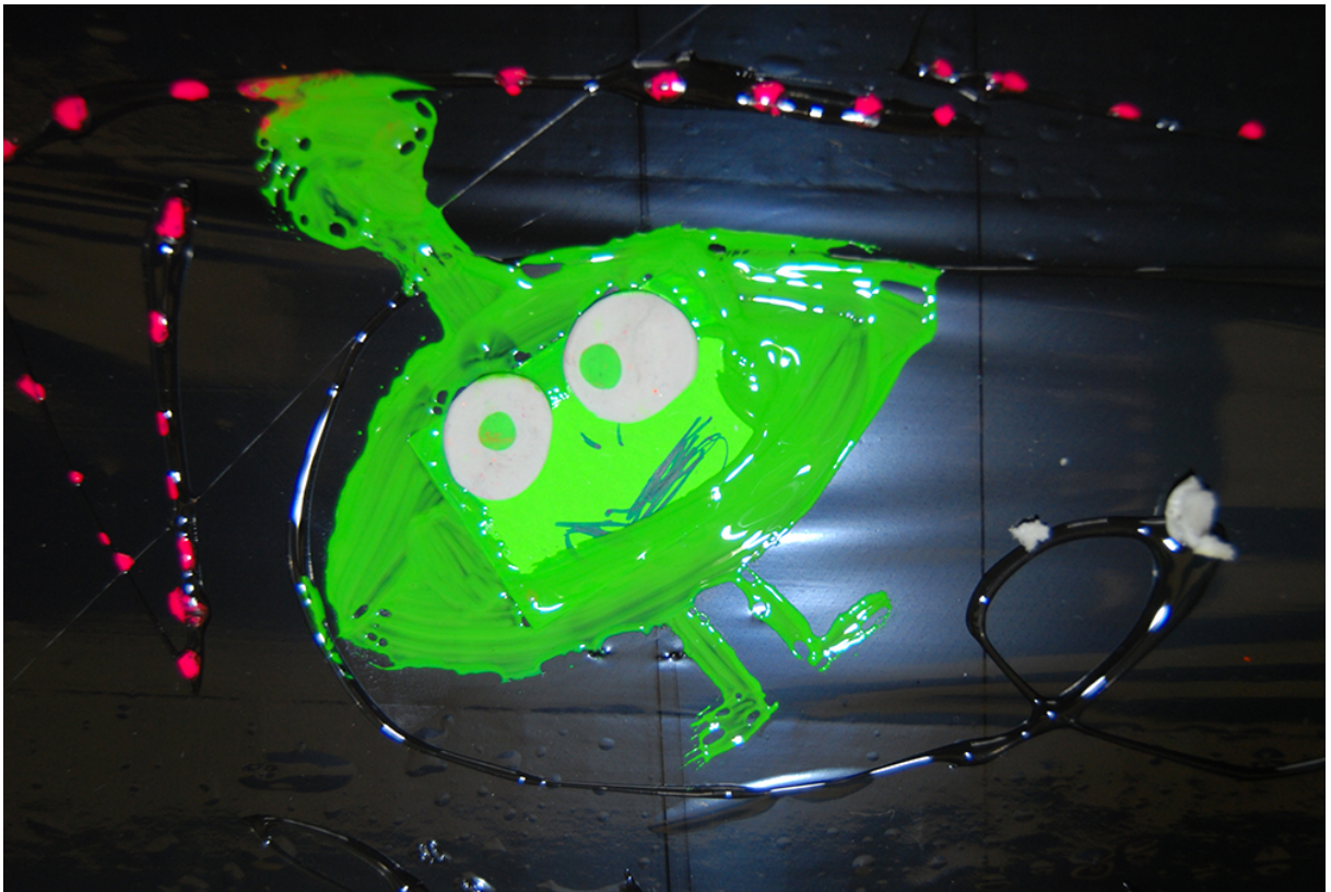
Фото 21. Проект «Свій світ», 2010 р.