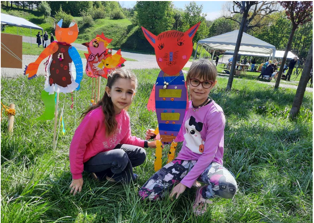
Фото 79. Проект «Майбутній світ», 2019 р.