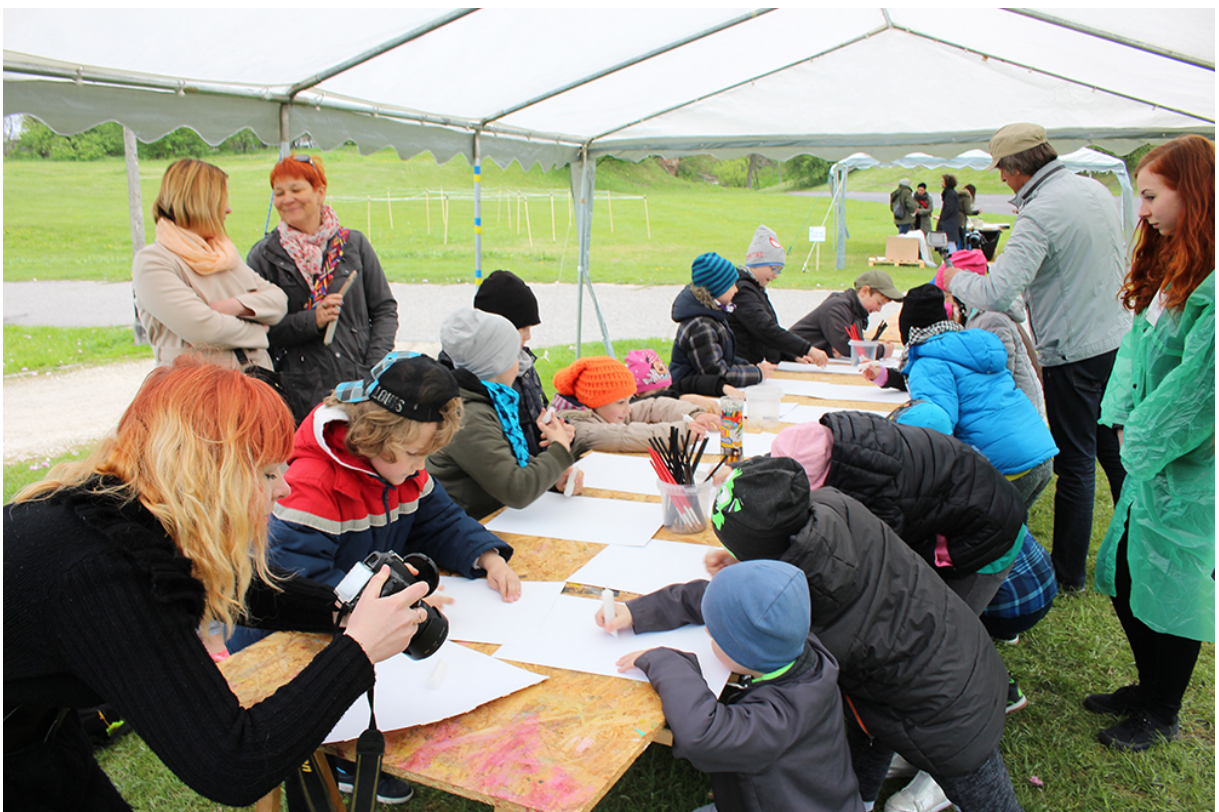
Фото 62. Проект «Невидимый портрет», 2017 р.