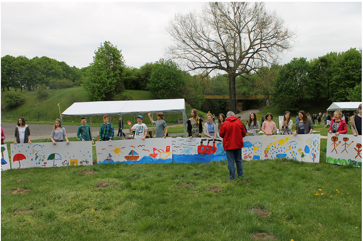
Фото 52. Проект «Безладна суміш звуків», 2015 р.