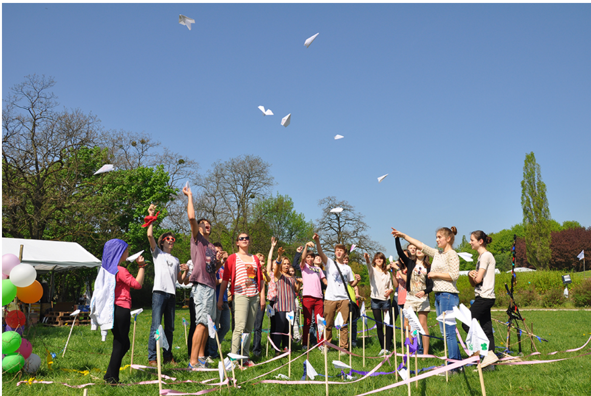
Фото 35. Проект «Форма слова», 2013 г.