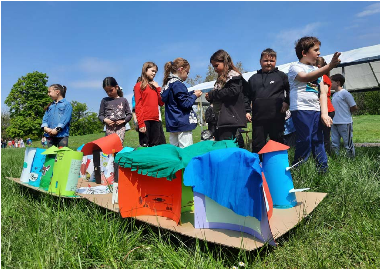
Фото 77. Проект «Майбутній світ», 2019 р.