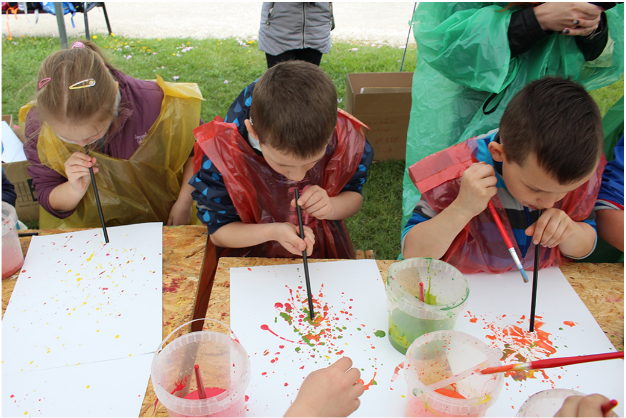
Фото 63. Проект «Невидимый портрет», 2017 р.