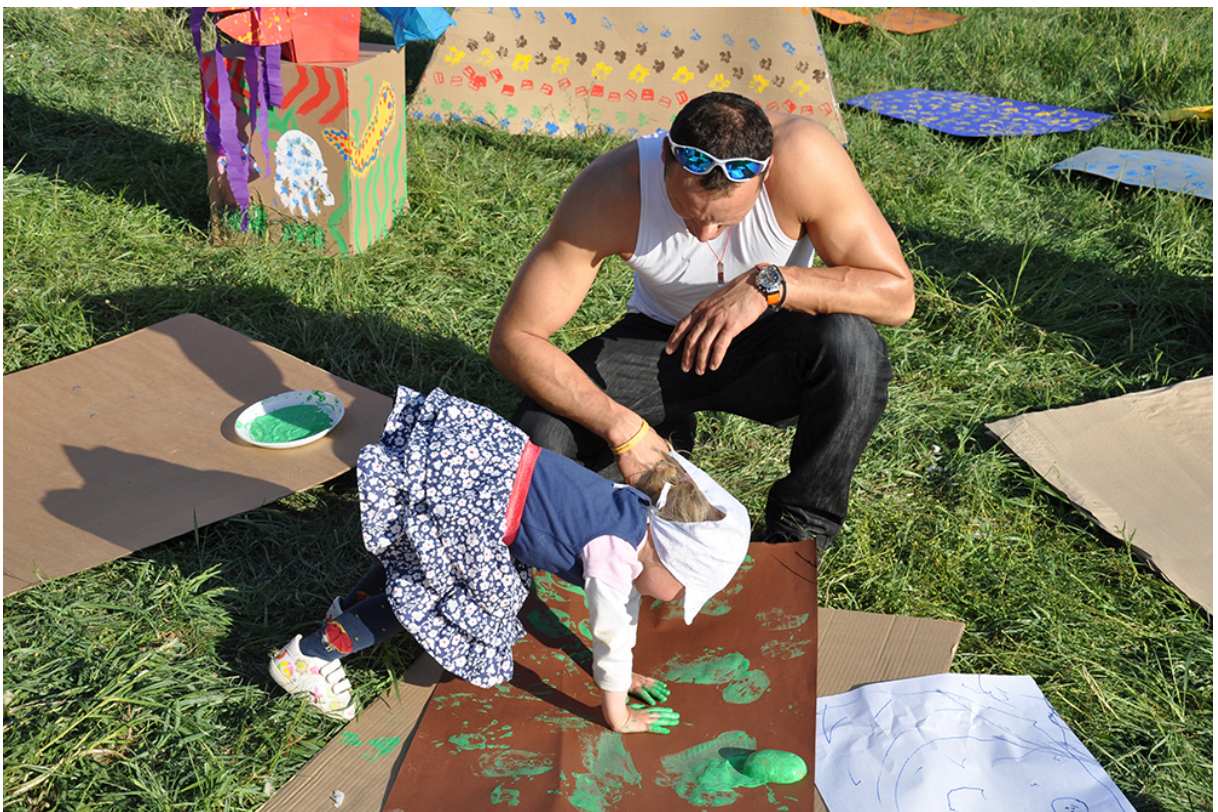
Фото 28. Проект «Сучасне індіанське селище», 2011 р.