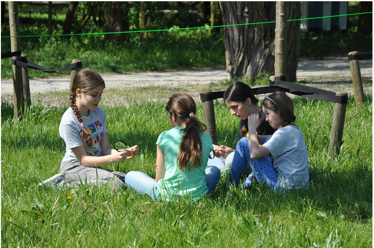
Фото 57. Проект «Мікрокосмос», 2016 р.