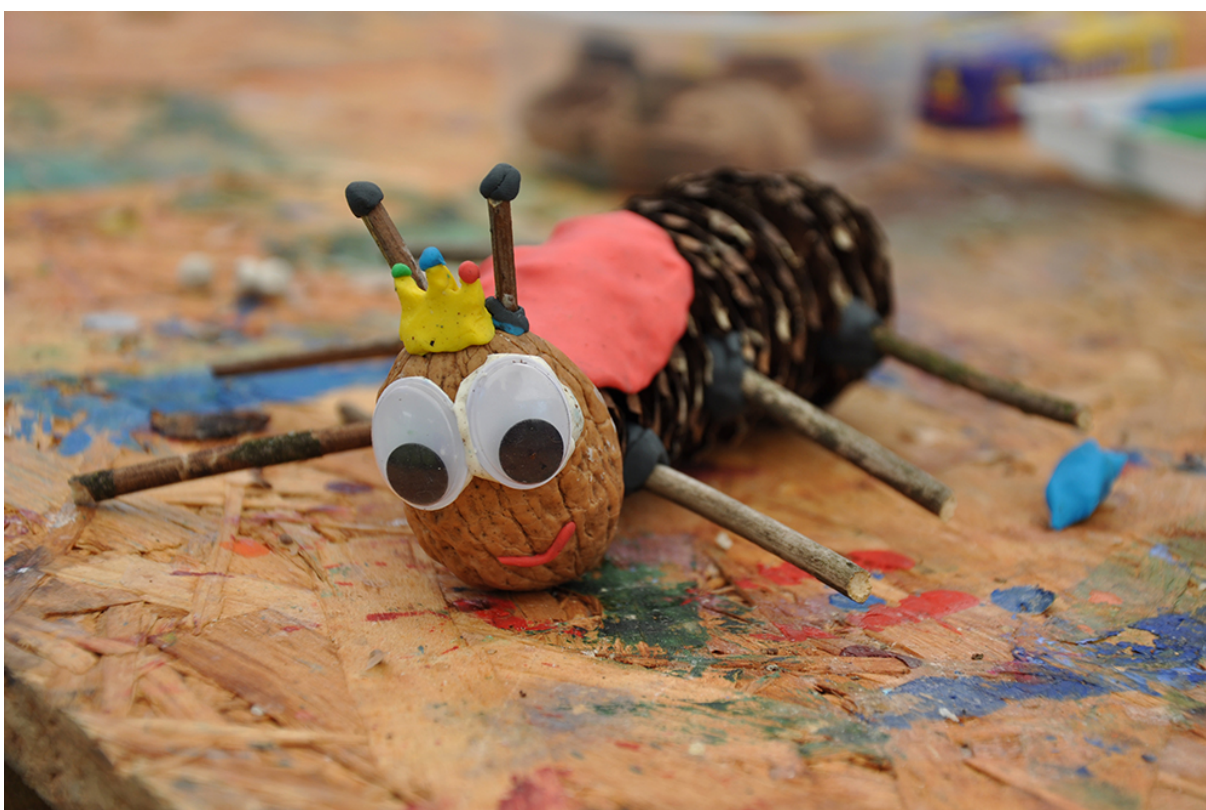
Фото 68. Проект «Стоп-моушн комах», 2018 р.