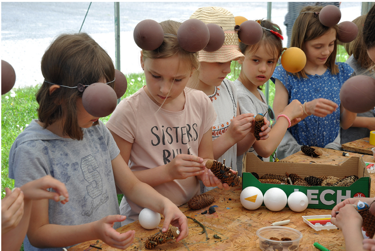
Фото 67. Проект «Стоп-моушн комах», 2018 р.