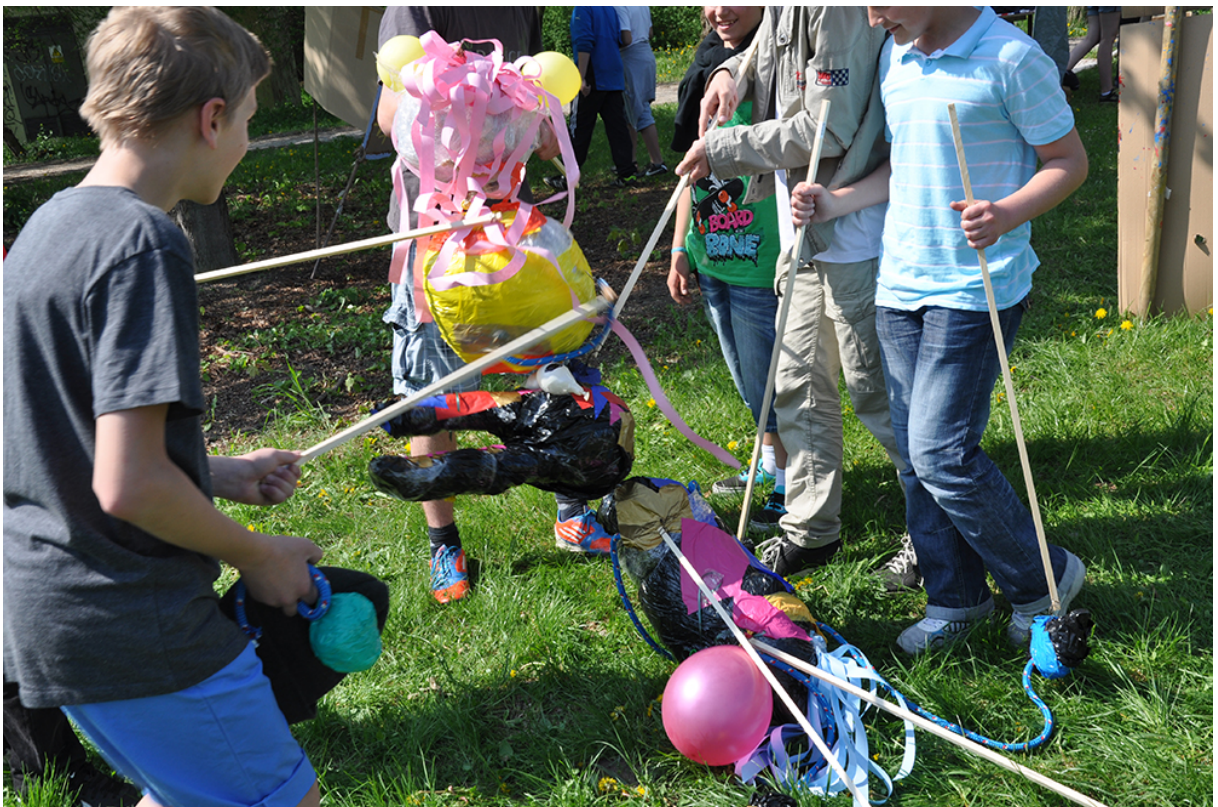
Фото 38. Проект «Форма слова», 2013 г.