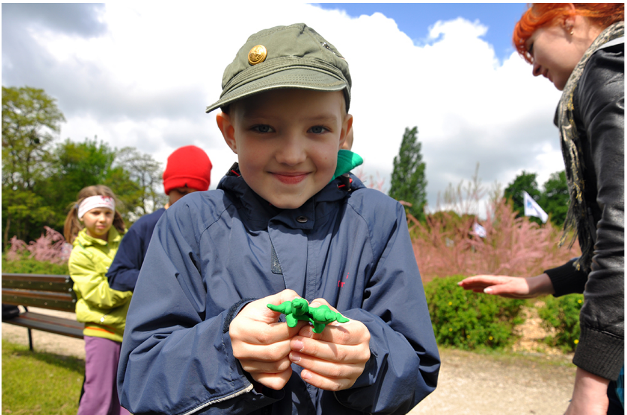
Фото 42. Проект «Анімація – Анагліф – Анімація», 2014 р.