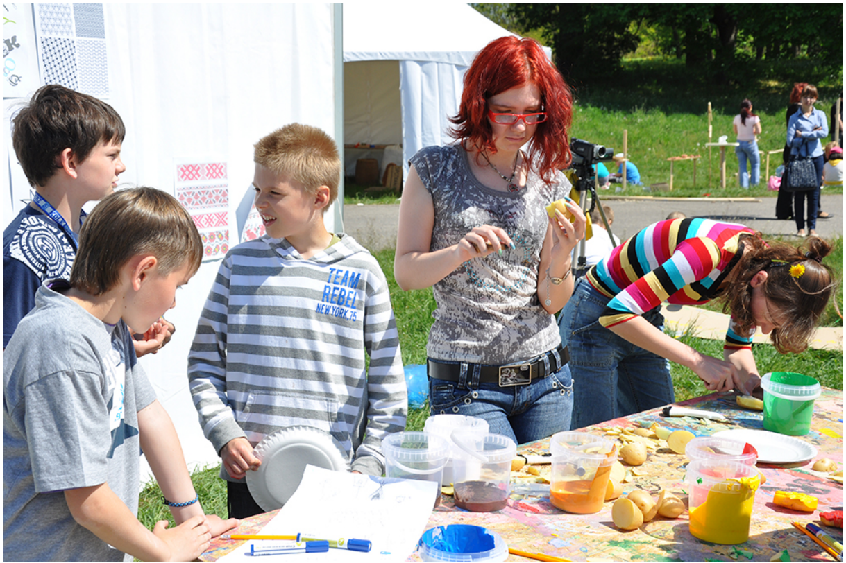
Фото 23. Проект «Сучасне індіанське селище», 2011 р.