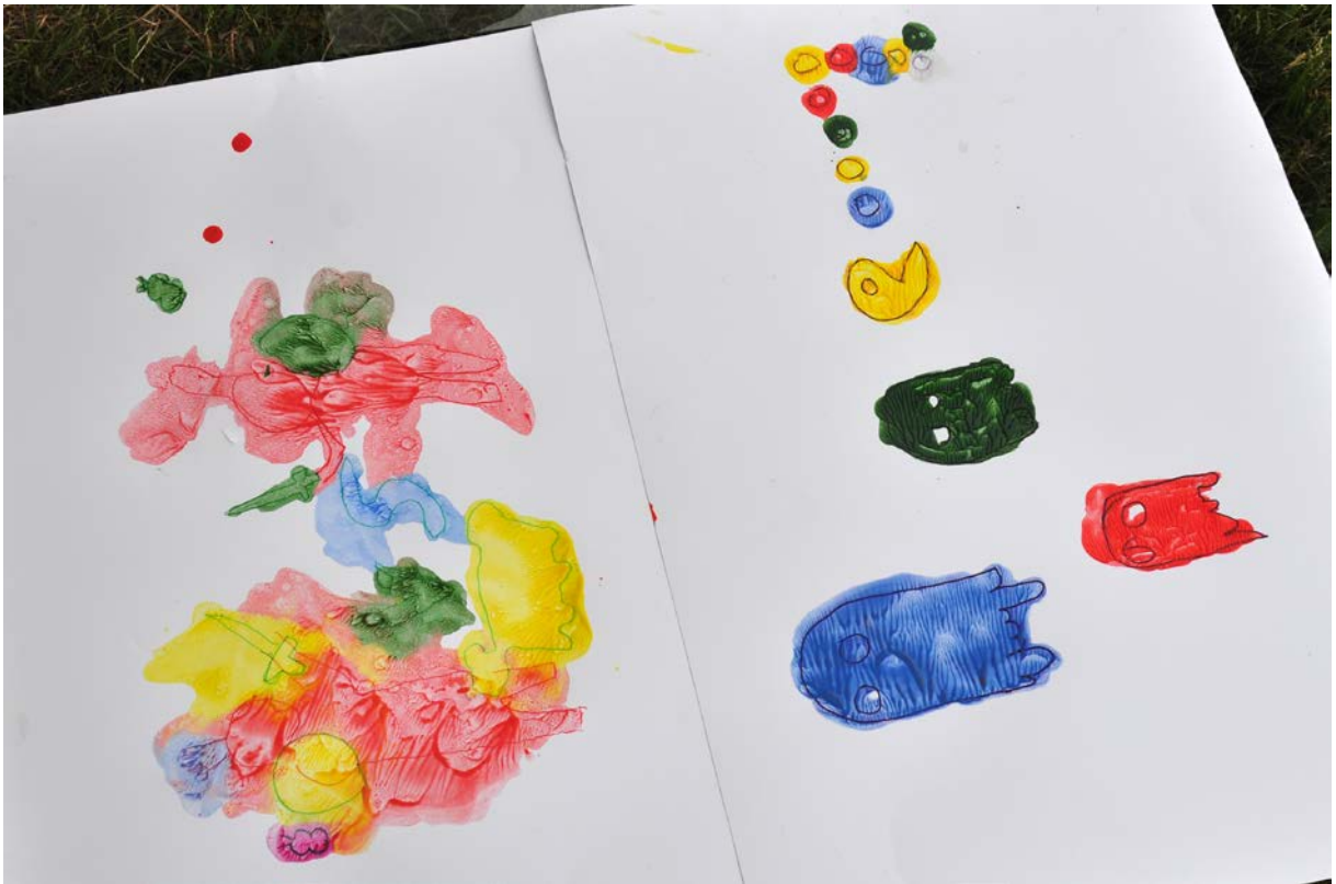
Фото 73. Проект «Від мистецтва до мистецтва», 2019 р.