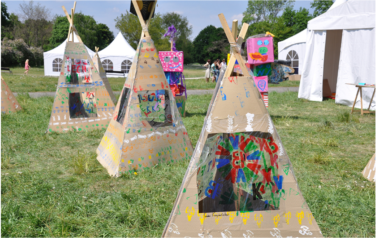
Фото 27. Проект «Сучасне індіанське селище», 2011 р.