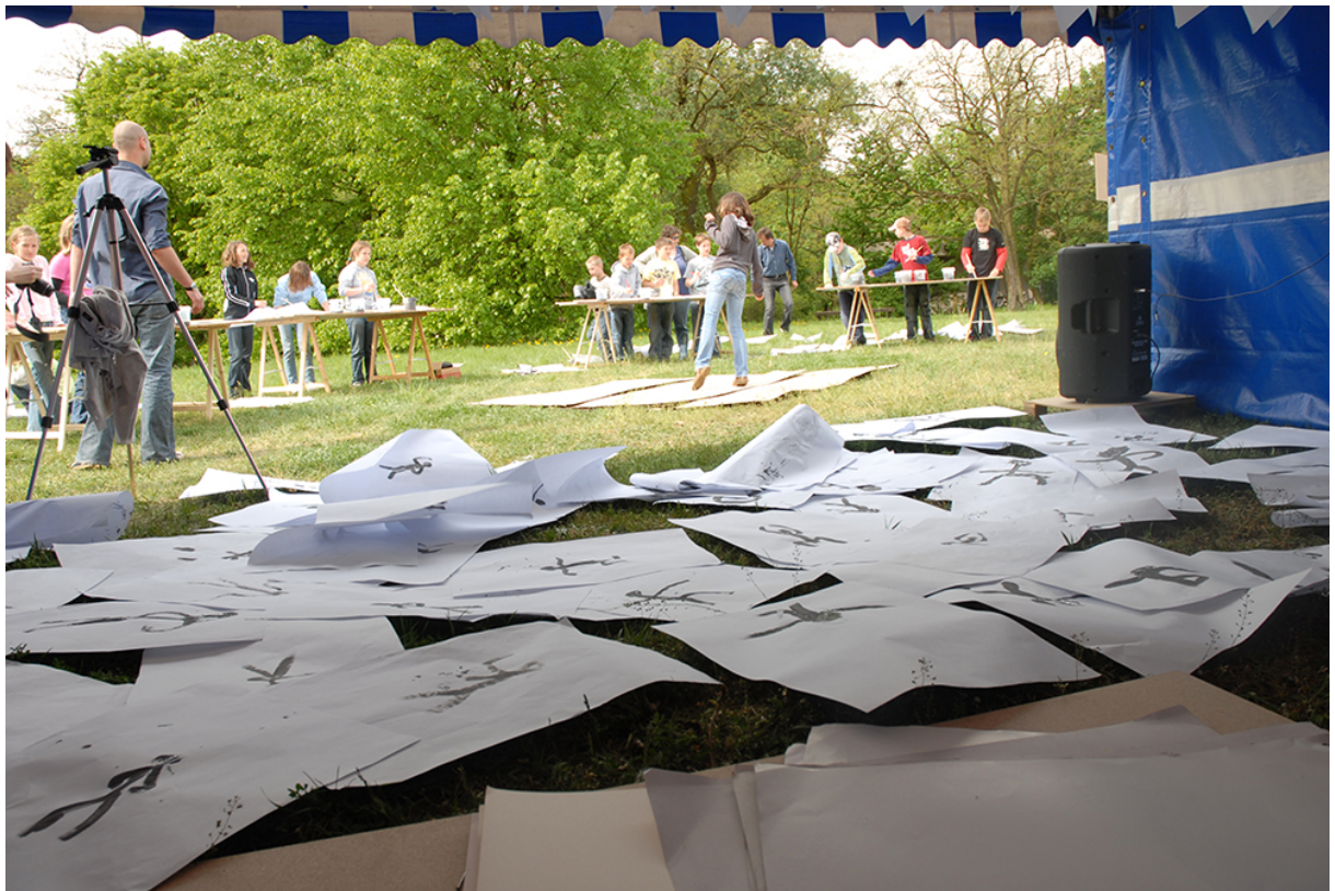
Фото 12. Проект «Малювання танцю», 2009 р.