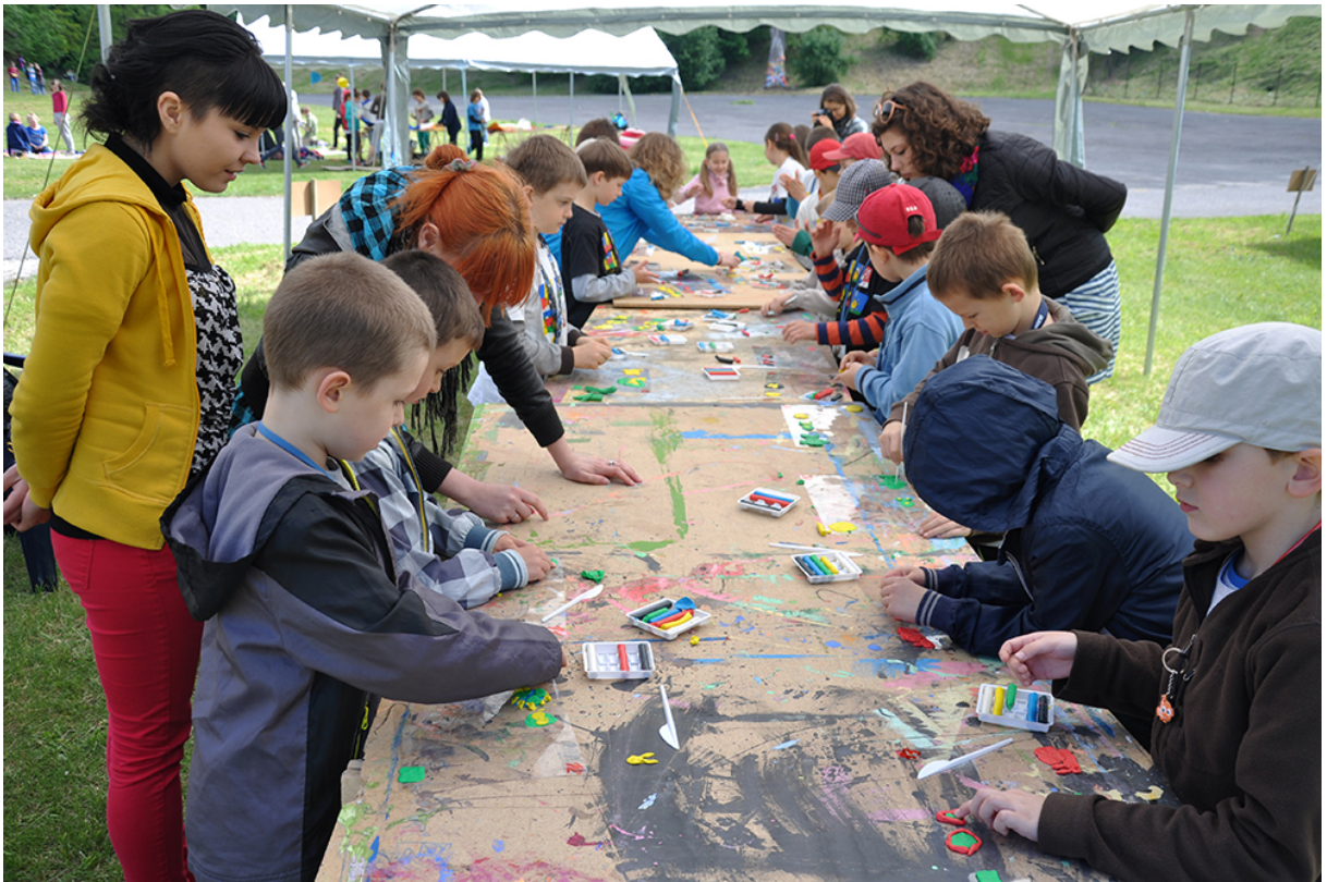
Фото 41. Проект «Анімація – Анагліф – Анімація», 2014 р.