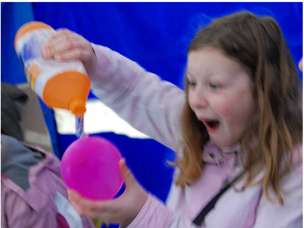
Фото 16. Проект «Свій світ», 2010 р.