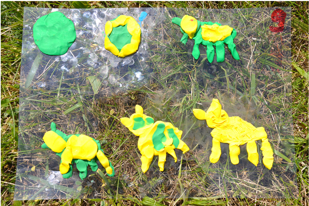
Фото 43. Проект «Анімація – Анагліф – Анімація», 2014 р.