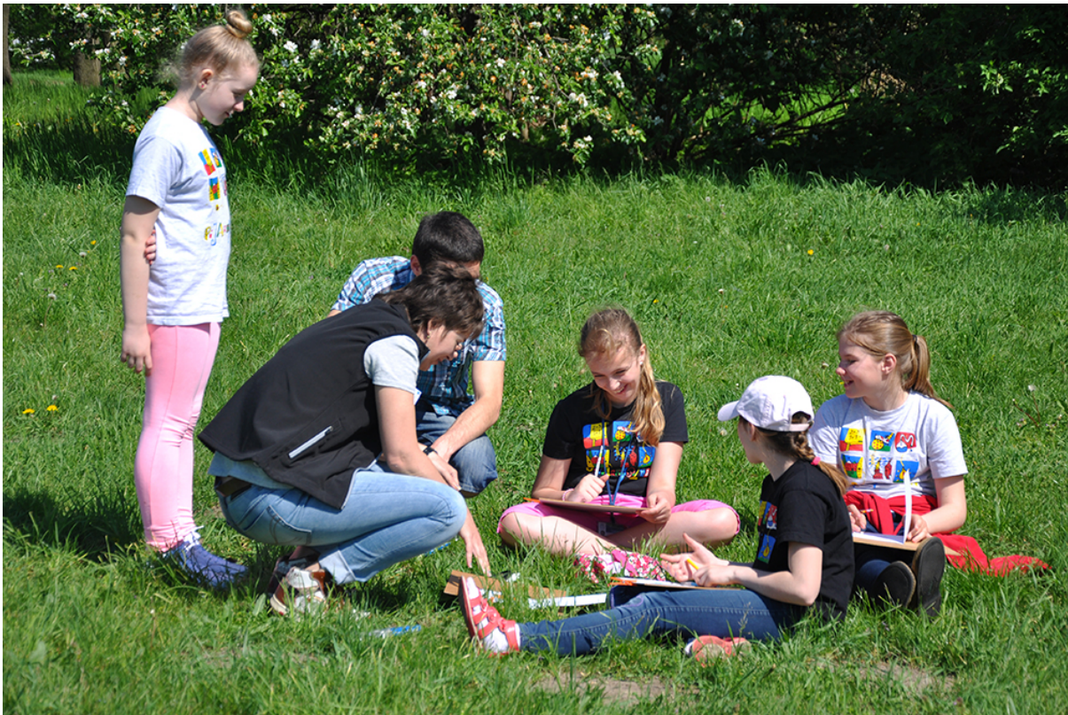
Фото 53. Проект «Мікрокосмос», 2016 р.