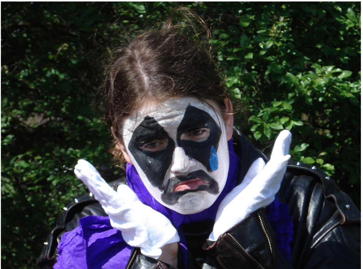
Фото 4. Проект «Фото-історія», 2007 р.