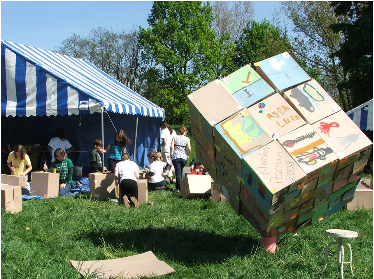
Фото 7. Проект «Сторони прогресу», 2008 р.