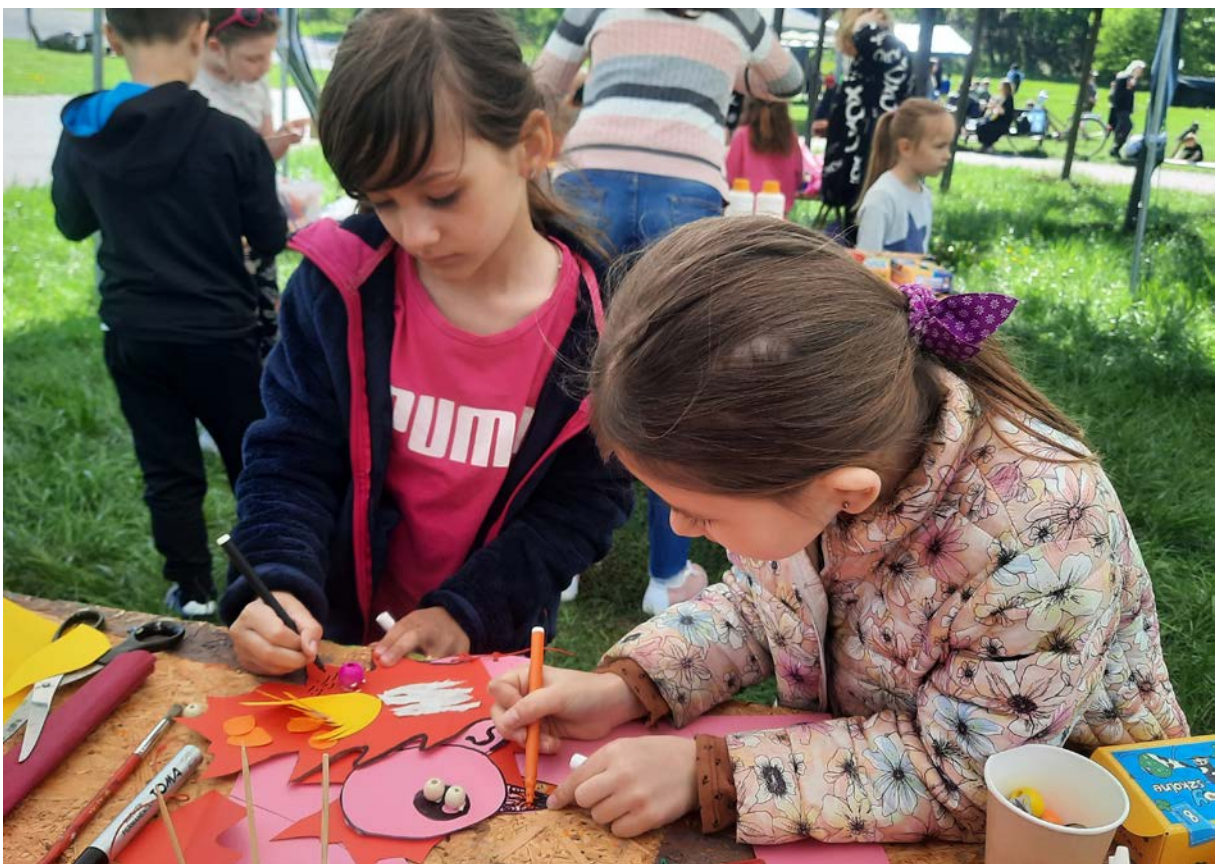
Фото 78. Проект «Майбутній світ», 2019 р.