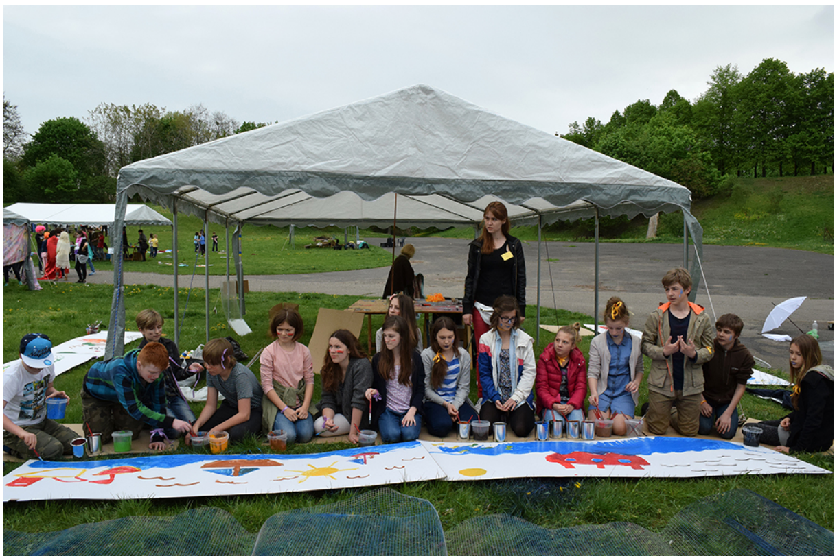
Фото 50. Проект «Безладна суміш звуків», 2015 р.