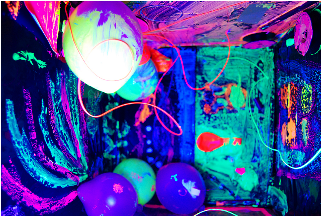
Фото 20. Проект «Свій світ», 2010 р.