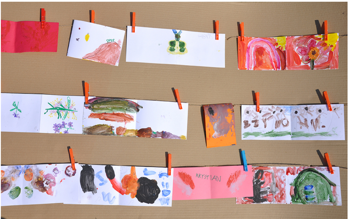
Фото 60. Проект «Мікрокосмос», 2016 р.