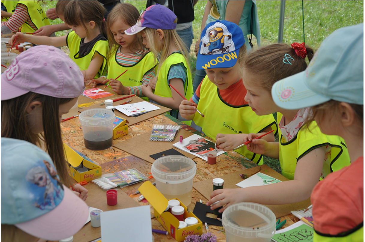
Фото 59. Проект «Мікрокосмос», 2016 р.