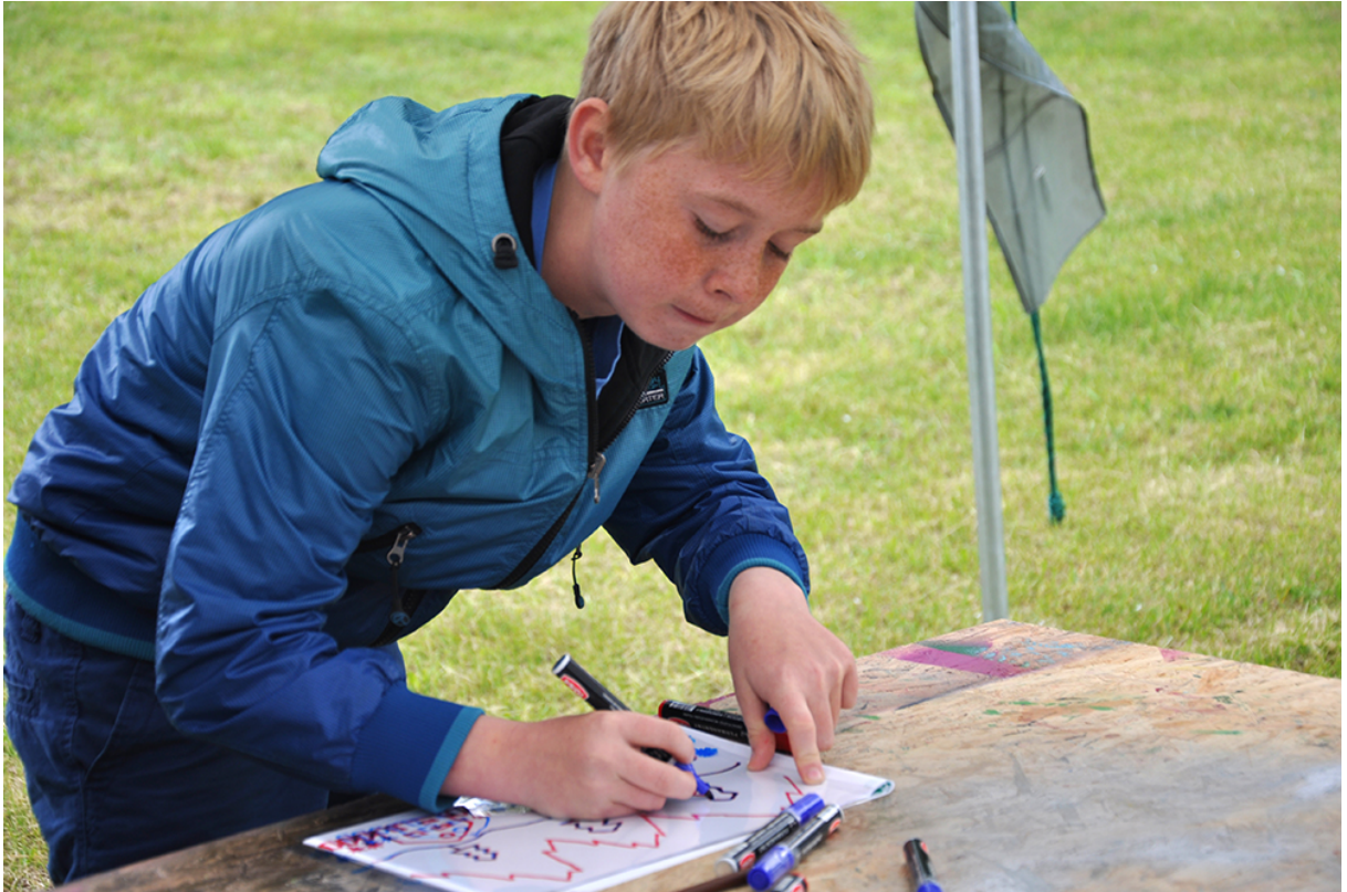
Фото 45. Проект «Анімація – Аналіф – Анімація», 2014 р.