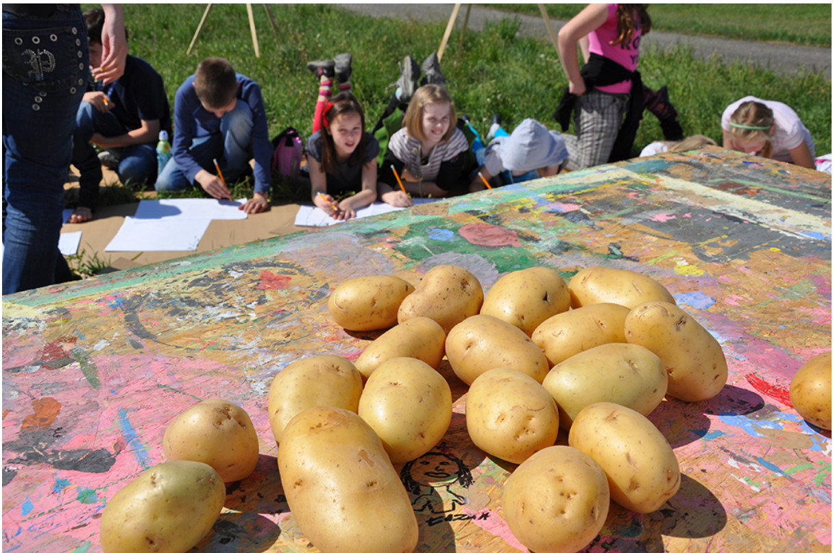
Фото 22. Проект «Сучасне індіанське селище», 2011 р.