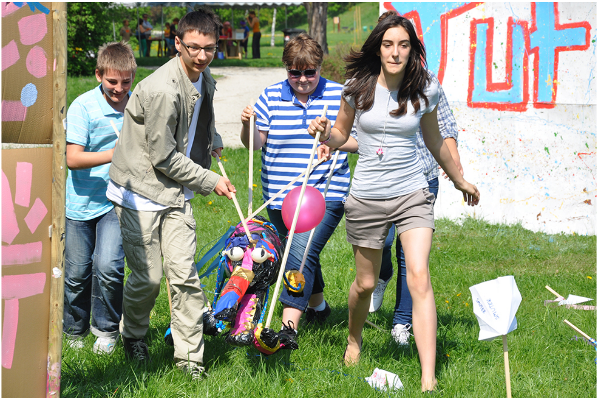
Фото 37. Проект «Форма слова», 2013 г.