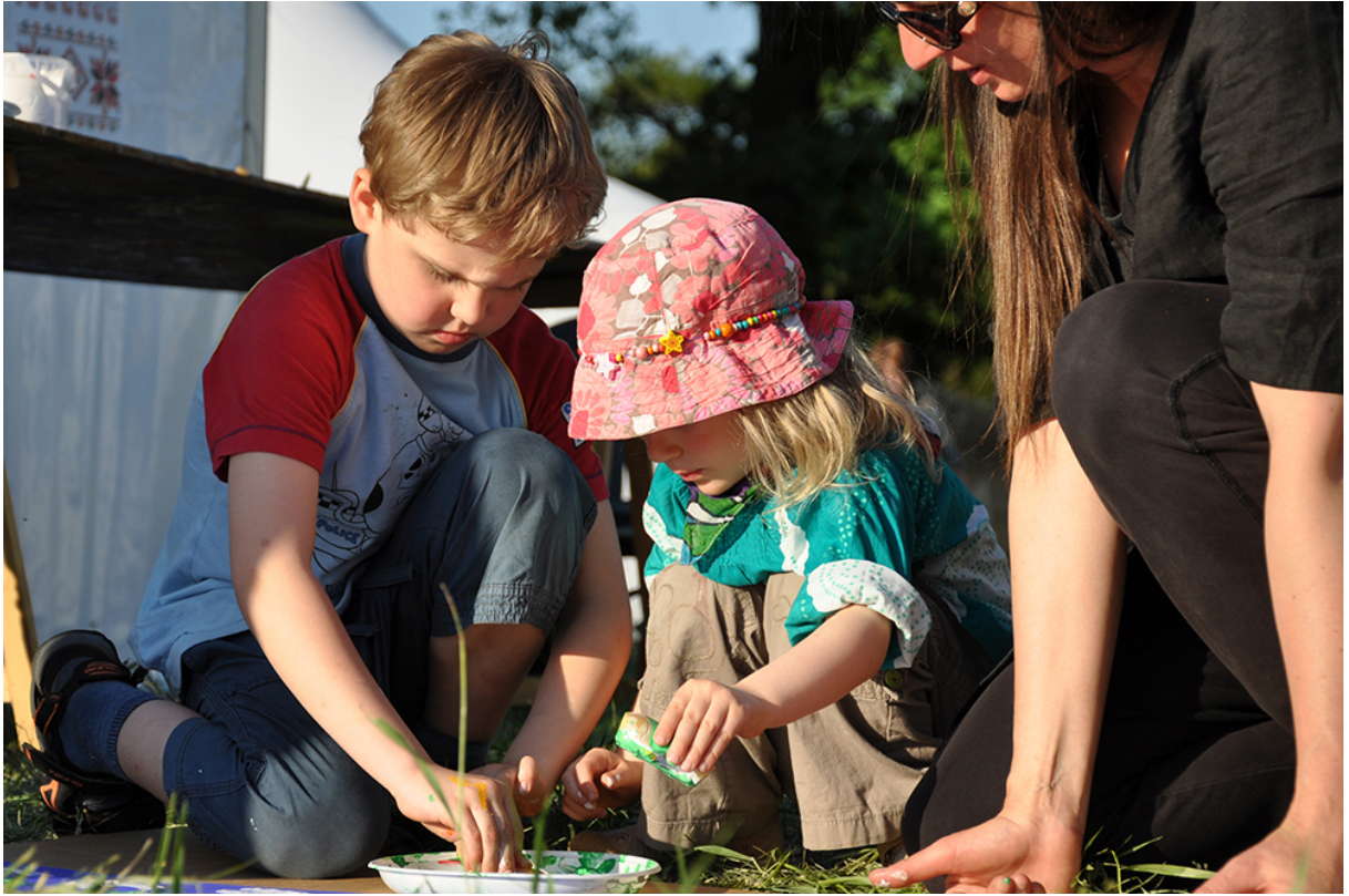
Фото 29. Проект «Сучасне індіанське селище», 2011 р.