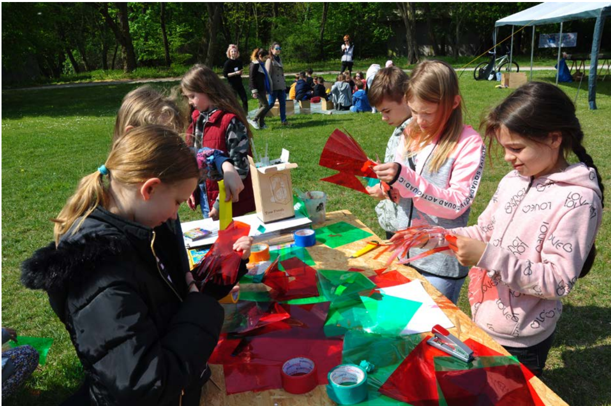
Фото 71. Проект «Від мистецтва до мистецтва», 2019 р.