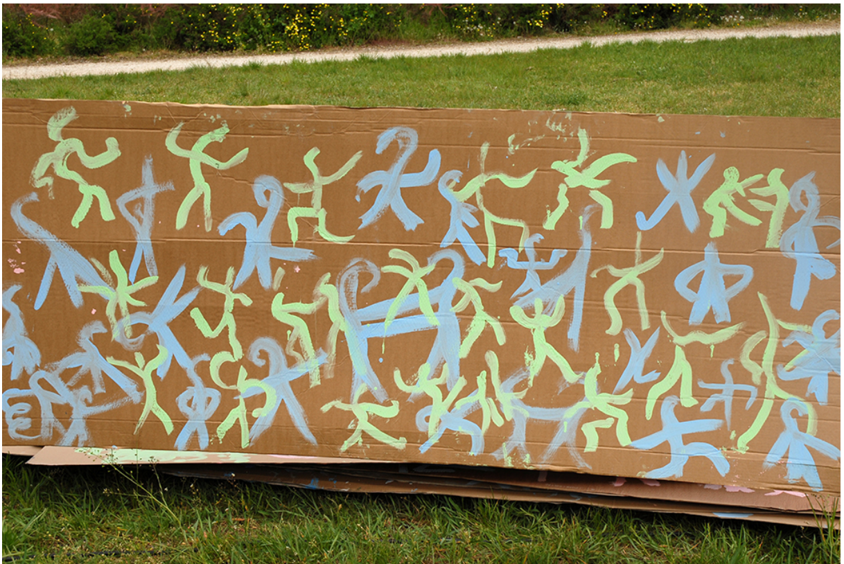
Фото 14. Проект «Малювання танцю», 2009 р.