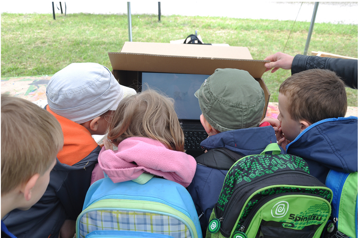
Фото 44. Проект «Анімація – Анагліф – Анімація», 2014 р.