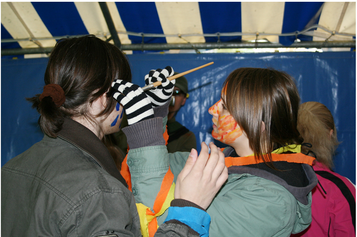
Фото 2. Проект «Фото-історія», 2007 р.