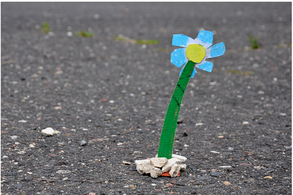
Фото 80. Маленьке диво творчості.