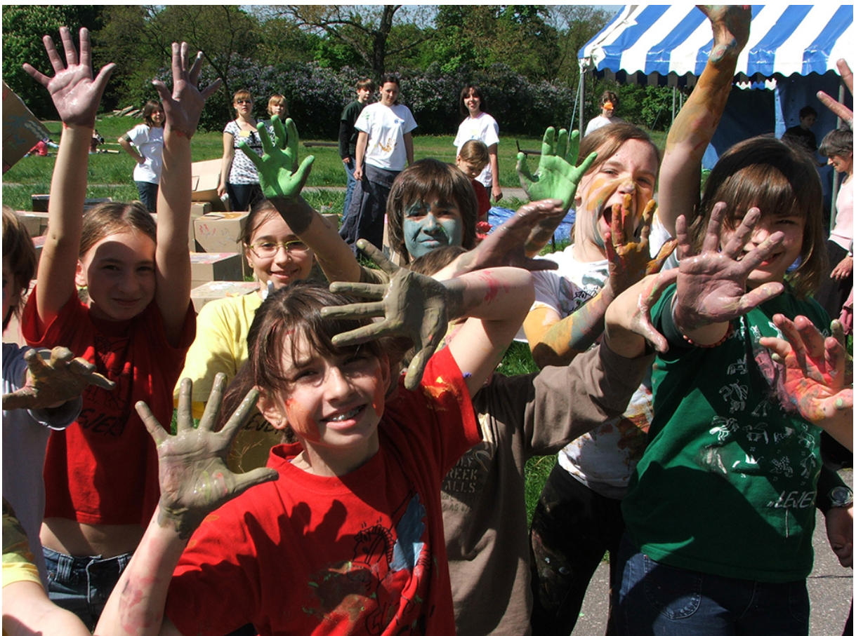
Фото 8. Проект «Сторони прогресу», 2008 р.