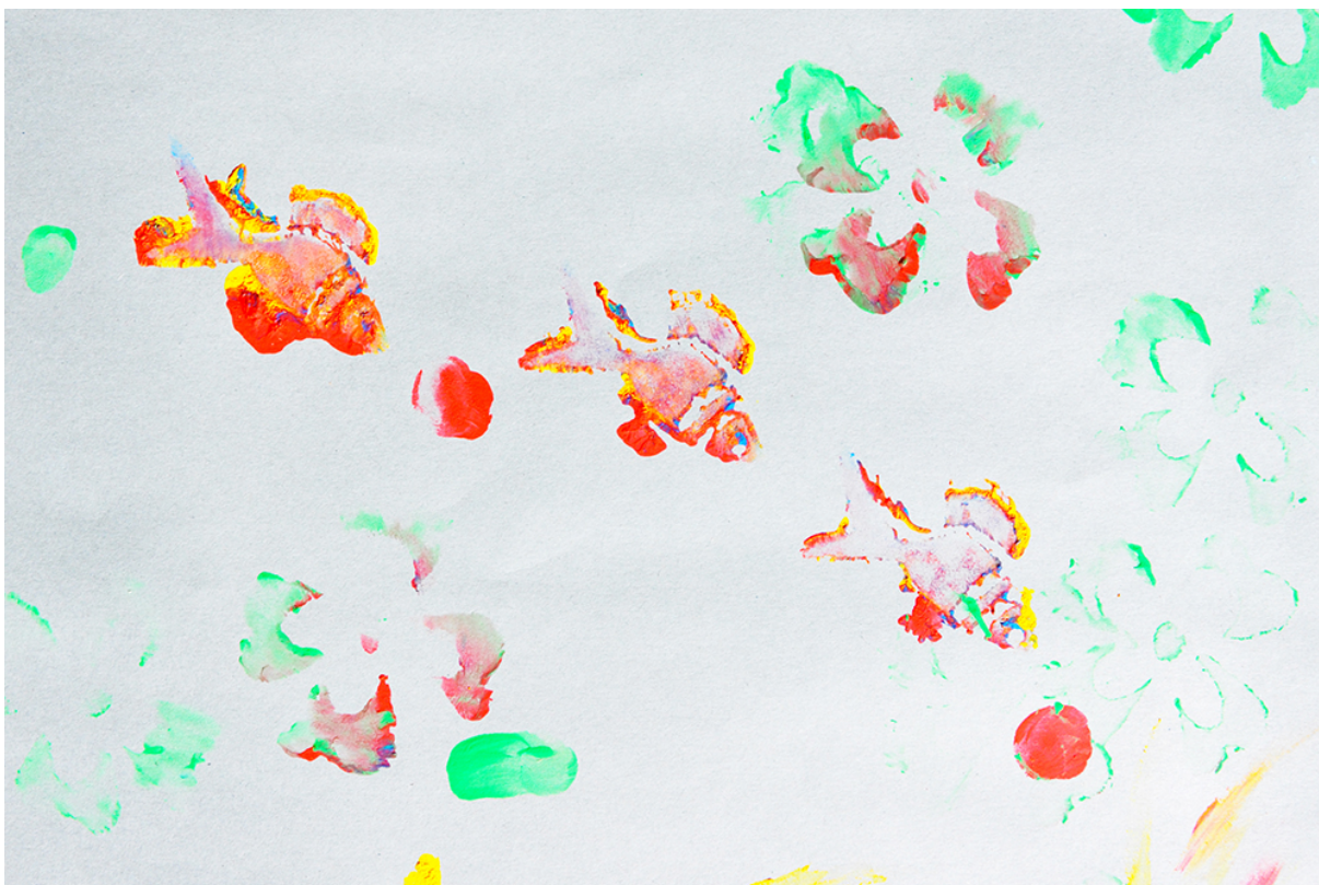
Фото 32. Проект «Сучасне індіанське селище», 2011 р.