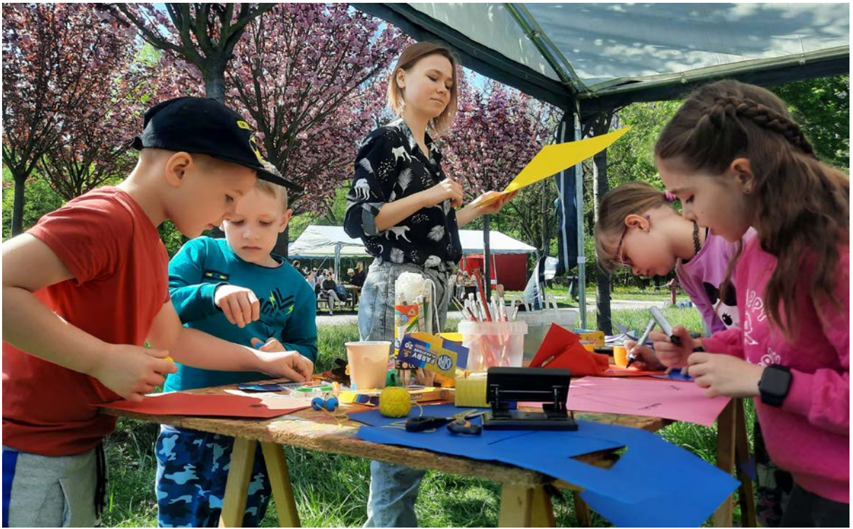
Фото 75. Проект «Майбутній світ», 2019 р.