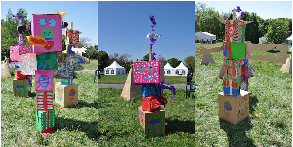
Фото 26. Проект «Сучасне індіанське селище», 2011 р.