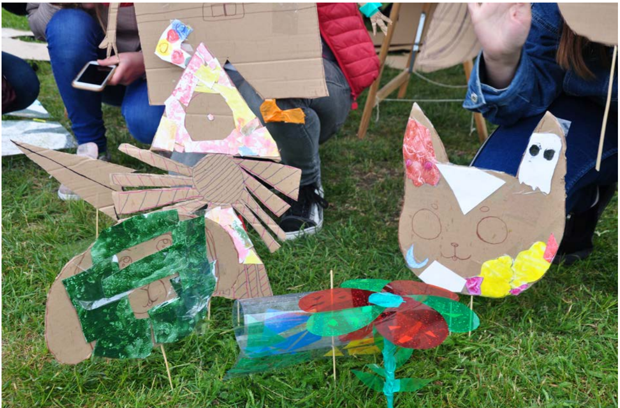
Фото 74. Проект «Від мистецтва до мистецтва», 2019 р.