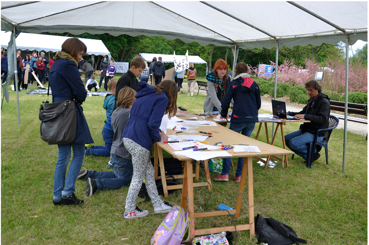
Фото 39. Проект «Анімація – Анагліф – Анімація», 2014 р.