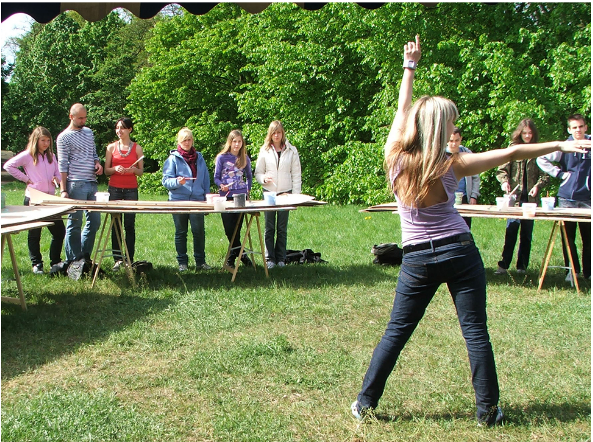
Фото 10. Проект «Малювання танцю», 2009 р.