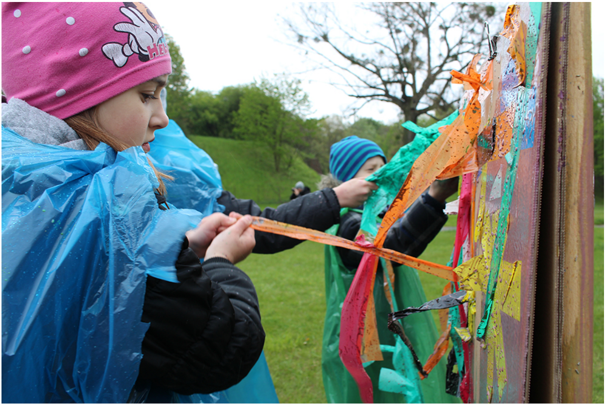
Фото 65. Проект «Невидимый портрет», 2017 р.