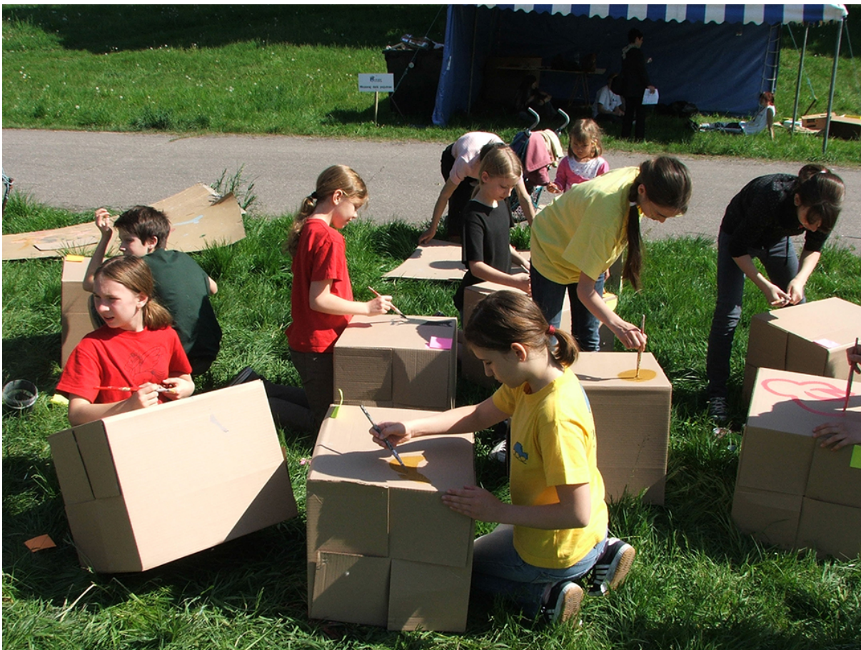
Фото 5. Проект «Сторони прогресу», 2008 р.