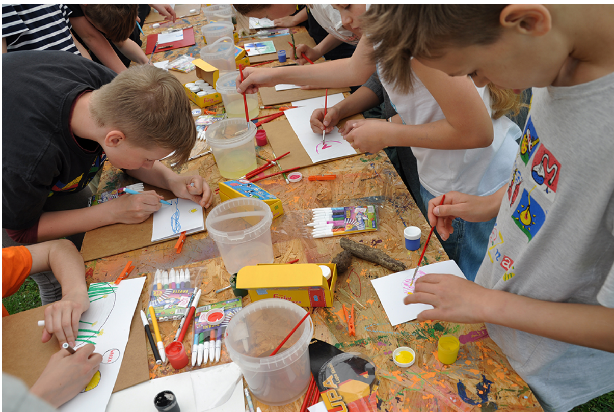
Фото 54. Проект «Мікрокосмос», 2016 р.