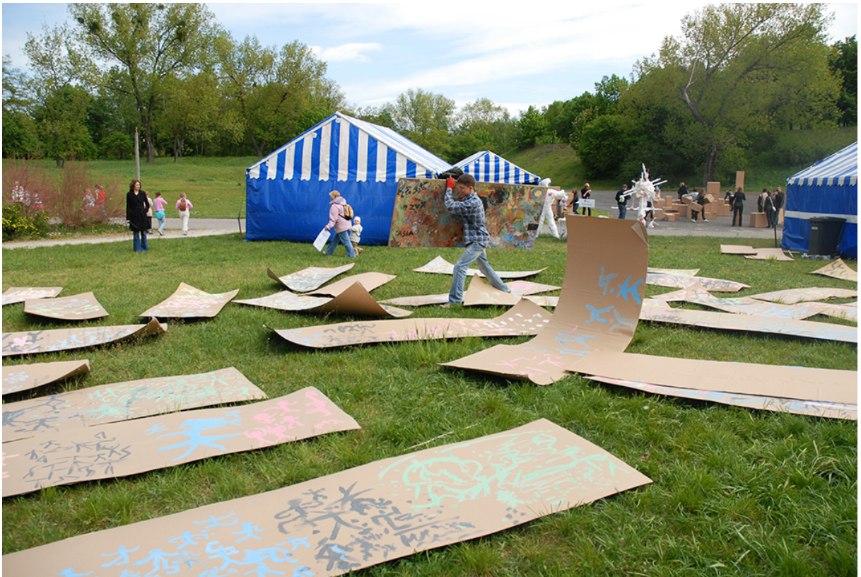
Фото 13. Проект «Малювання танцю», 2009 р.