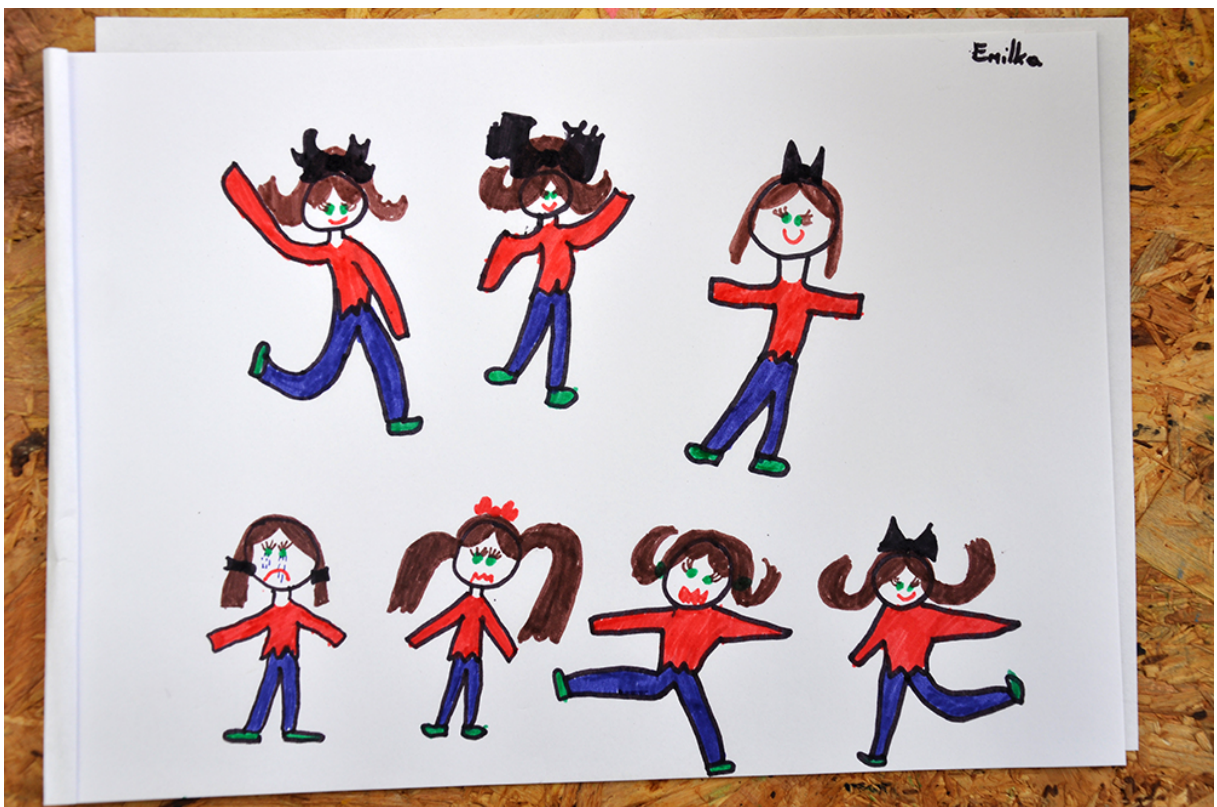
Фото 40. Проект «Анімація – Анагліф – Анімація», 2014 р.