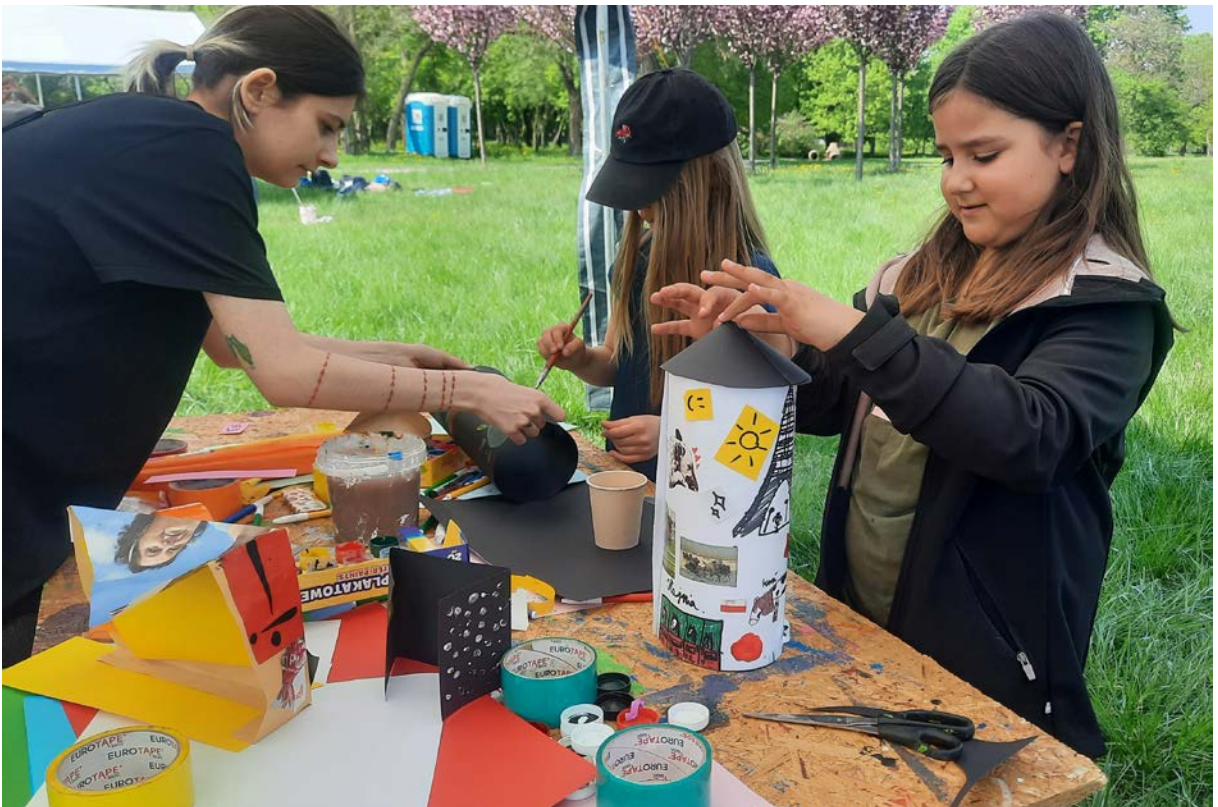
Фото 76. Проект «Майбутній світ», 2019 р.