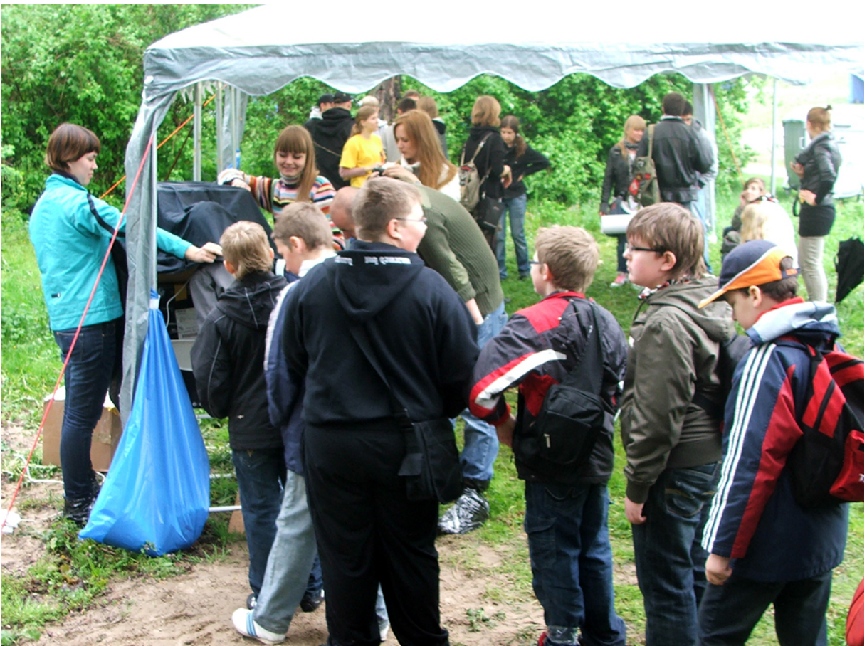
Фото 18. Проект «Свій світ», 2010 р.