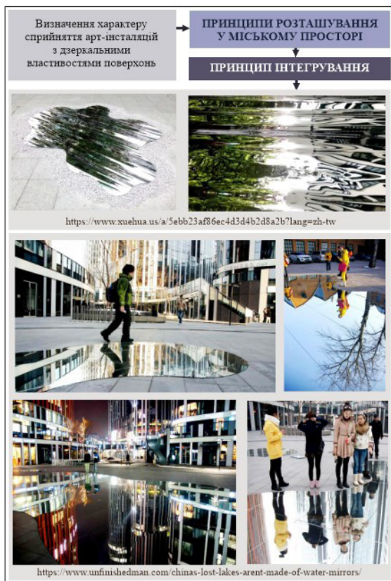
Рис. 3. Приклади формування дизайну арт-інсталяцій на основі принципу інтегрування