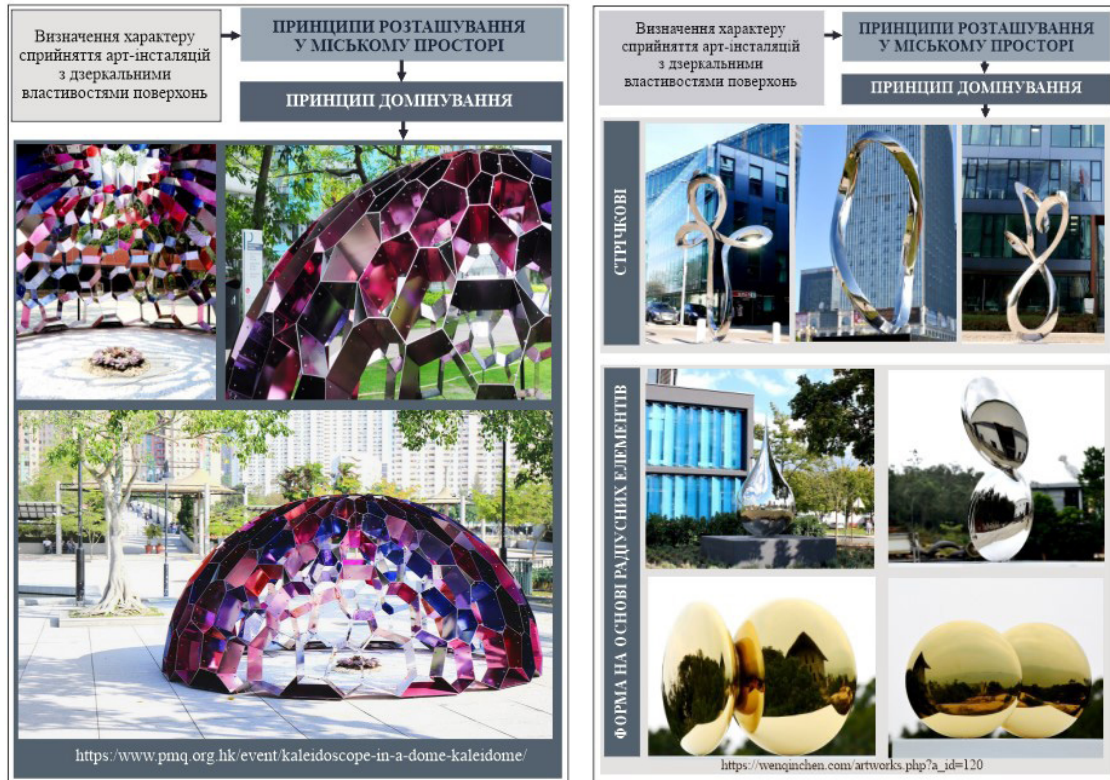
Рис. 1–2. Приклади формування дизайну арт-інсталяцій на основі принципу домінування